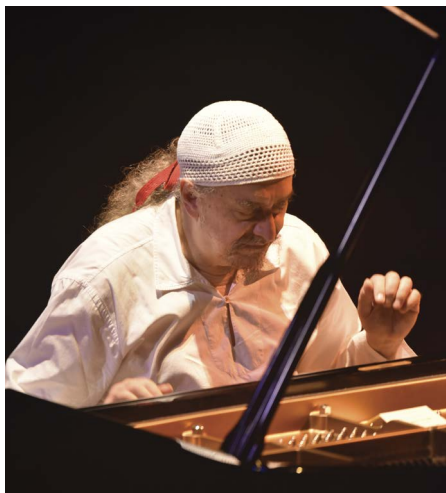
Egberto Gismonti.