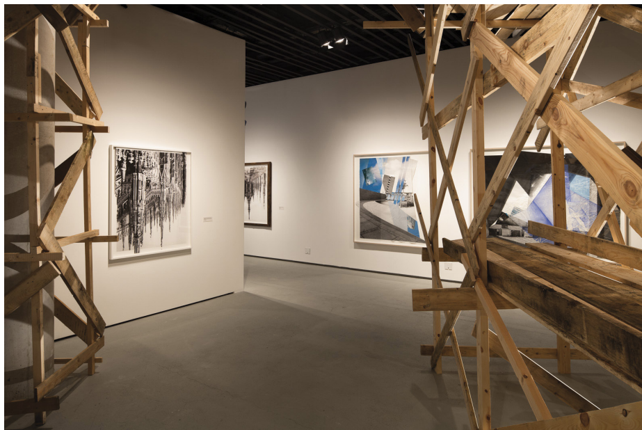
Interior fra udstillingen "Vi byggede et hus"