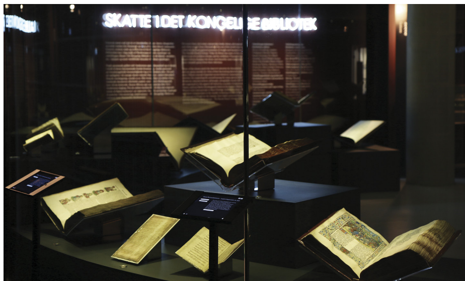
Fra den nyåbnede skatteudstilling, som kan ses i Montanasalen året ud – og 2017 med!