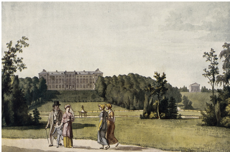
Frederiksberg Have med slottet i baggrunden. Tegning af C.W. Eckersberg. (Det Kongelige Bibliotek, Billedsamlingen)

børn som ældre og med “fuld Music og 7 Musicanter”. 30 Dette foregik tre dage om ugen, mandage, onsdage og lørdage. Også dansemestrene Rose og Villeneuve fremkom med tilbud om dans, men også med undervisning i fægtning!