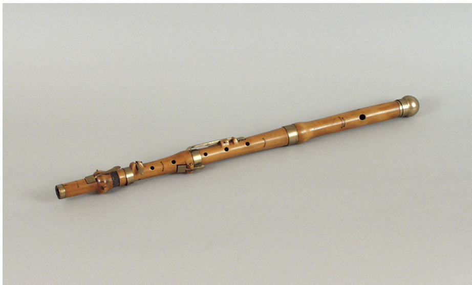
Tertsfløjte bygget af Skousboe.

gjort af “beste sort Boxbom”. De havde elfenbensringe, to klapper og tre mellemstykker. En Skousboe-traverso med to ekstra mellemstykker befinder sig i privat samling, og klapperne er sat til at betjene Dis (på fodstykket) og Gis (på anden mellemstykke). De ordinære traverser (i C) blev betalt med otte Rigsdaler, tertsføjterne (i Es) med syv. Alle blev leveret i skindfutteral til 3 mark stykket. Det samlede køb var for 32 Rigsdaler. 18