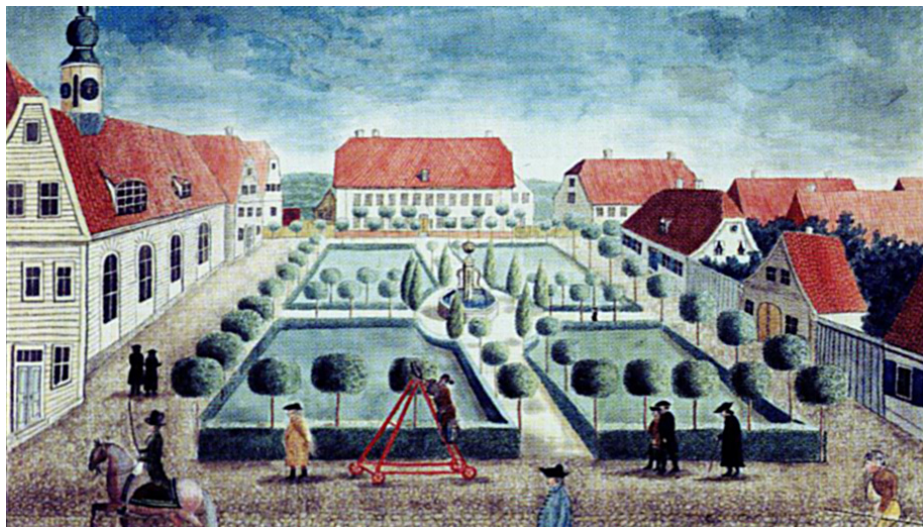
Ill. 1: Akvarel fra 1797, som viser kirkepladsen i Christiansfeld, er af en ukendt kunstner. Søstrehuset ses i baggrunden, mens kirken er afbildet til venstre.