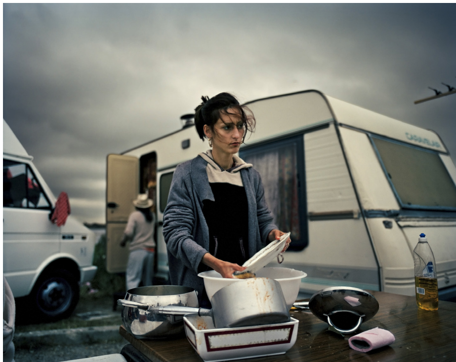
Saintes Marie de la Mer II, 2004 (Roma Journeys).

af et nærmest naturromantisk tilsnit, men den indeholder dog også enkelte portrætter, og de klinger lige så rent som lære-sterens. En rynket fisker fremstår nærmest "Mydtskovsk"; lyset modellerer det skarpt gengivne ansigt, så furerne bliver smukke, og modellens stærke blik hviler værdigt i betragterens. Fotografiet forestiller en personlighed – af lige dele råstyrke, tålmodighed og erfaring. Selvom det er en illusion, så føler man som betragter, at man kender denne mand, om end titlen ikke engang fortæller, hvad han hedder.