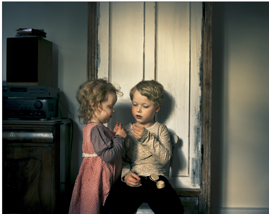
The Tooth, 2012 (Home Works).