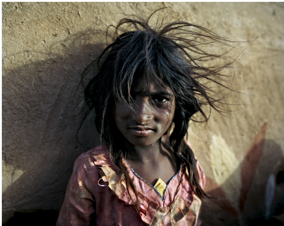
Sapera Girl, Jaisalmer District, 2006 (Roma Journeys).

levevilkår på kanten af samfund, der ofte udsætter dem for systematisk kulturel undertrykkelse og fattigdom. Serien skildrer dels disse mennesker som enkeltindivider, dels deres fællesskaber med karakteristika og forskelle, som ofte overses i en mediedækning præget af stereotyper.