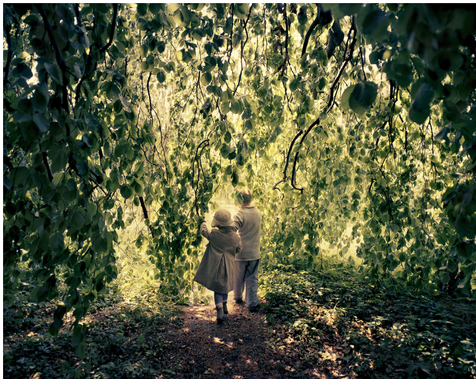
Willow Tree, 2012 (Home Works).