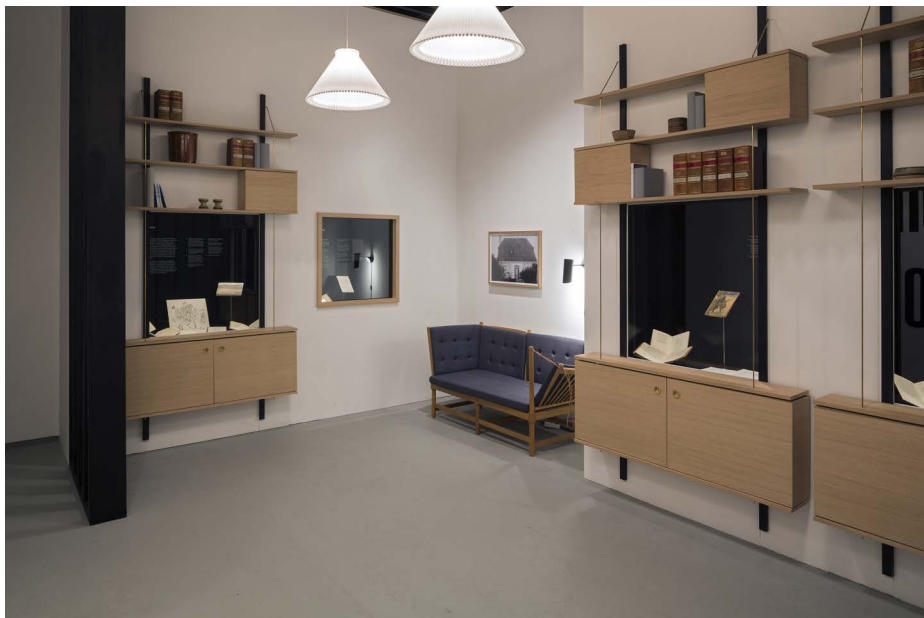
Udstillingen vises i et 'modernistisk' 60'er-miljø.

Som redaktør af udstillingen har jeg haft det privilegium som den første at pakke indholdet af de 72 flyttekasser ud, som Klaus Rifbjerg løbende har afleveret til biblioteket siden 1982. En stor, men også bevægende oplevelse, da jeg dagligt nødvendigvis måtte konfrontere den enorme vitalitet og selvudfoldelse, der så at sige sprang ud af kasserne, med bevidstheden om Klaus Rifbjergs sygdom, der altså viste sig at være fatal.