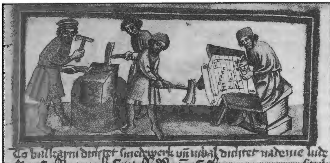
Tuba-Kain, smedenes stamfader og Jubal, "stamfader til alle dem, der spiller på citer og fløjte" (1. Mosebog, kap. 4), her fremstillet som nodeskriver. Fra Den menneskelige frelses spejl , Tyskland, første halvdel af 1400-tallet.

melodi. Denne melodi (også kendt i engelske kilder) er dobbelt så lang som den første, men også den kan opføres som rondellus . 7 Om meningen har været, at hymnen skal synges ved at skifte melodi strofe for strofe, eller om de to er alternative melodier, er ikke klart.