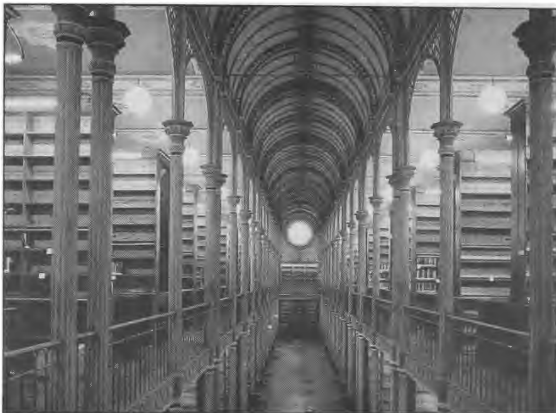
Efter manges mening en af det 19. århundredes smukkeste biblioteksrum: bogsalen i Fiolstræde med omløbende galleri.

lioteks fjernmagasin på Lergravsvej, 1 km mikrofilm til den midlertidige læsesal på Amager og 3,4 km aviser til Rigsarkivets centralmagasin i Glostrup.