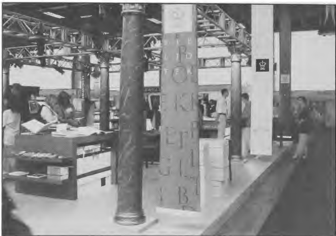
Fra Det Kongelige Biblioteks stand i Bella Centret under IFLA-konferencen. På standen forenedes søjler fra den oprindelige biblioteksbygning fra slutningen af 1600-tallet med bibliotekets nye design fra 1990'erne.

Swets (Amsterdam) som sponsorer. Hertil kom væsentlige bidrag fra biblioteksorganisationerne, de største forskningsbiblioteker som Det Kongelige Bibliotek, Statsbiblioteket, Danmarks Natur- og Lægevidenskabelige Bibliotek og Danmarks Biblioteksskole m.fl. Ud fra antallet af deltagere blev det den hidtil største internationale bibliotekskonference siden IFLA grundlæggelse i 1927.