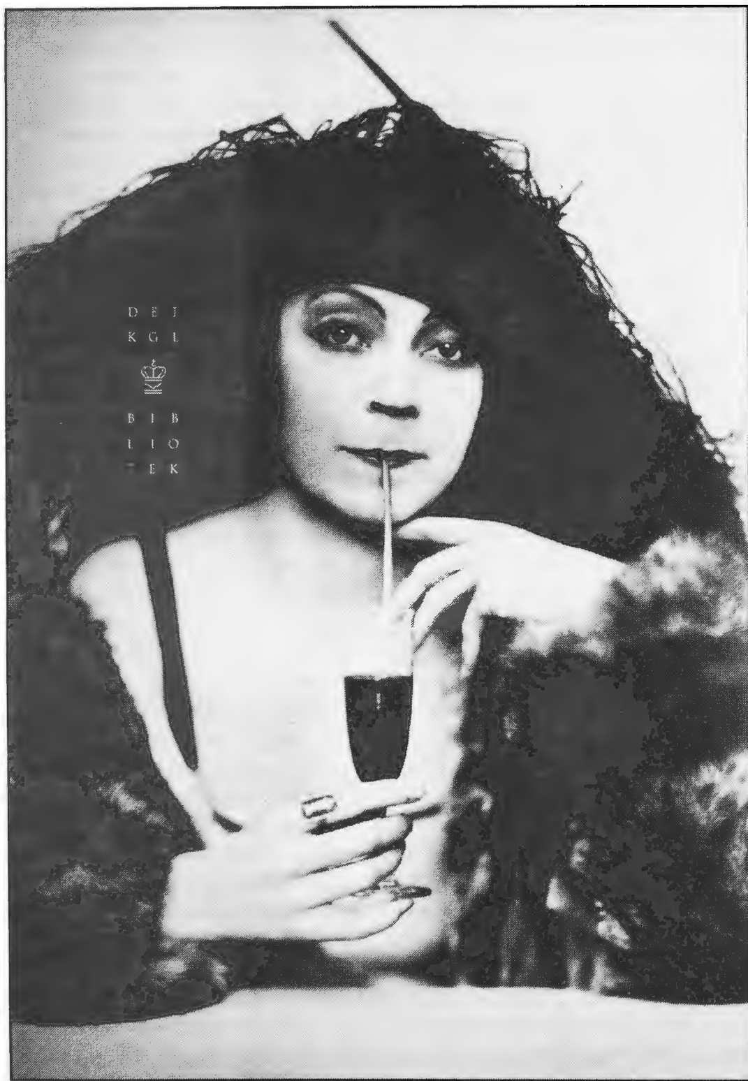
Skuespilleren Asta Nielsen. Postkort udgivet af forlaget "Ross", Berlin, 1912. Fot. Becker & Mass, Tyskland. Kort- og Billedafdelingen. - Forhandles som plakat (70 x 100) af Det Kongelige Bibliotek. Pris: kr. 100,-