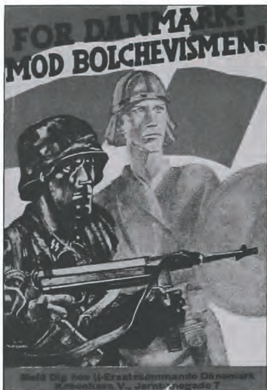
"For Danmark mod Bolshevismen". SS-hverveplakat med antikommunistisk indhold 1944.

marks Fjende Nummer 1". I december 1944 sendte Høyer hilsner til soldaterne ved fronten, som han ønskede ville sejre over "de nedbrydende Kræfter, der vil tage Jule-Evangeliet fra os alle" 31