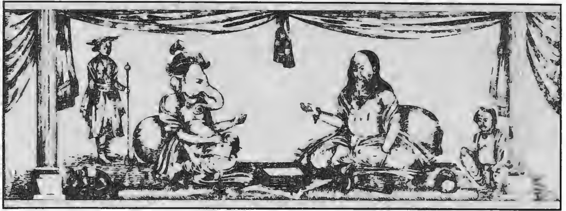
Vismanden Vyasa dikterer det store epos Mahabharata til guden med elefanhovedet Ganesha. Træsnit i indisk udgave fra 1863.

Hinduismen har i tidens løb optaget mange forskellige religiøse retninger i sig. Kravet var, at de indordnede sig under den bestående samfundsordning, d.v.s. at de anerkendte brahmanerne som den højeste sociale klasse. Det var endvidere et krav, at de - i det mindste formelt - anerkendte vedaerne som højeste religiøse autoritet. Religiøse ledere, der ikke ville anerkende disse principper, blev af de ortodokse betragtet som kættere. To af dem formåede at fremsætte en lære, der fik betydning for eftertiden. Det var Mahavira, jainismens grundlægger, og Buddha.