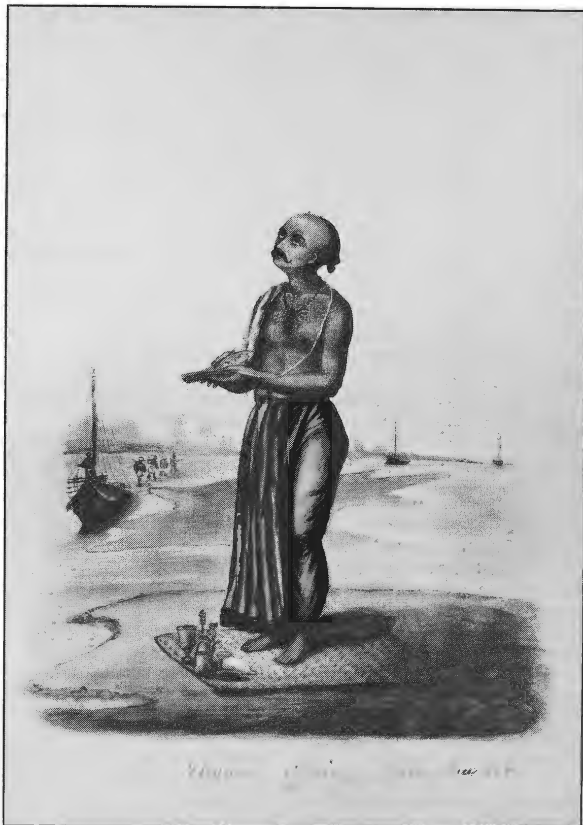
Ofring og bøn til guden Vishnu.