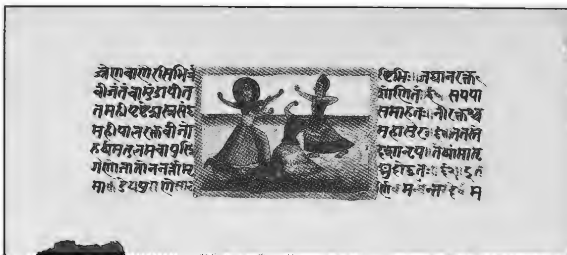
Gudinden Durga - Shivas hustru - i hendes grusomme og ødelæggende aspekt. Illustration i nepalesisk håndskrift.

Guden Brahma har sikkert på et tidligt tidspunkt haft en selvstændig betydning i hinduismen, men senere har han hovedsagelig fået betydning, fordi han sammen med Vishnu og Shiva udgør en treenighed. I begyndelsen af hver ny verdensperiode skaber Brahma hele Universet på Vishnus og Shivas anmodning. Vishnu opretholder det, og Shiva ødelægger det.