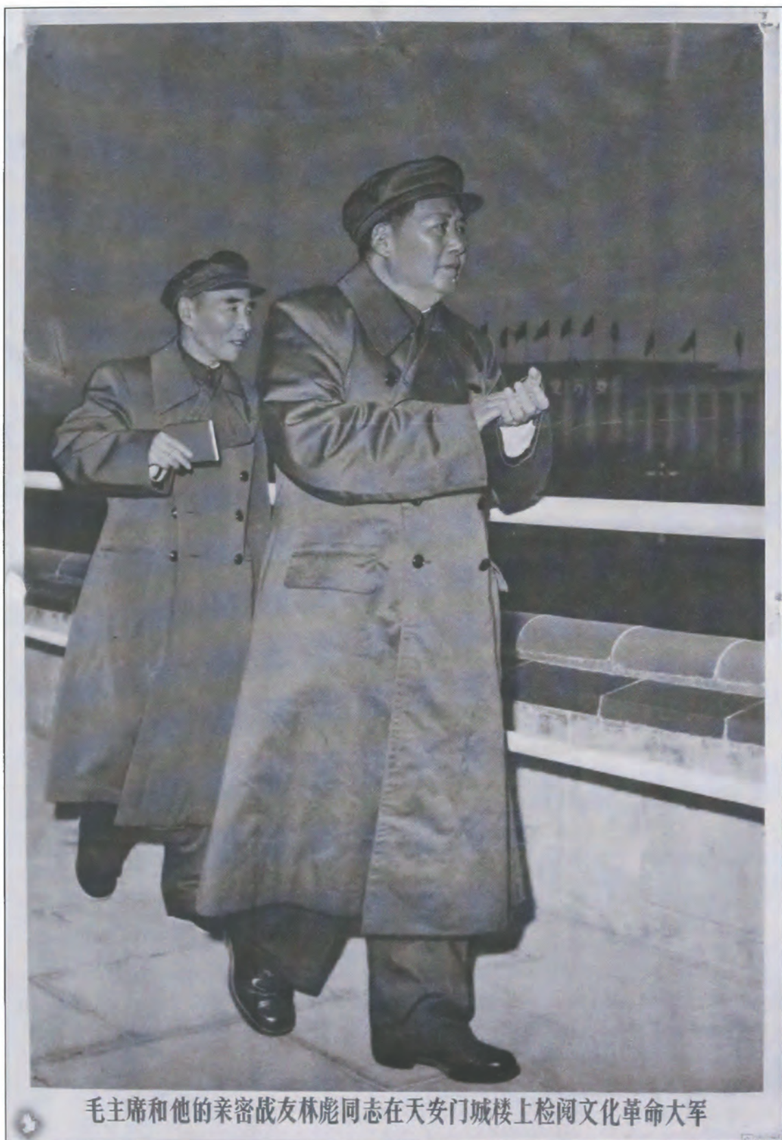
毛主席和他的亲密战友林彪同志在天安门城楼上检阅文化革命大军