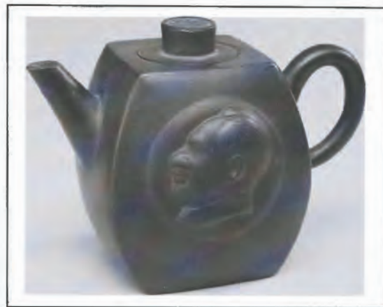
Moderne tepotte fra Yixing med portræt af Mao Zedong i profil på den ene side og inskriptionen Fengyi zushi ziji dongshou ("Overflod kommer nok fra mad, men start selv med at arbejde") på den anden side. Låg og potte er stemplet med fremstillernes Wu Shungengs navn. Formodentlig produceret i 1965. (Ca. 10 cm høj) (Det Kongelige Bibliotek).

D a mange af de asiatiske sprog har alfabeter eller tegn, der er meget velegnet til at udforme i kalligrafiske udgaver, har afdelingen også købt kinesisk kalligrafi i et mindre omfang. Af den grund er der blevet erhvervet nogle kalligrafiske eksempler i kopi på Mao Zedongs håndskrift som f.eks. plakater med gengivelse af egne citater i kalligrafisk form og to tepotter fra 1965 med indgraverede kalligrafiske sentenser.