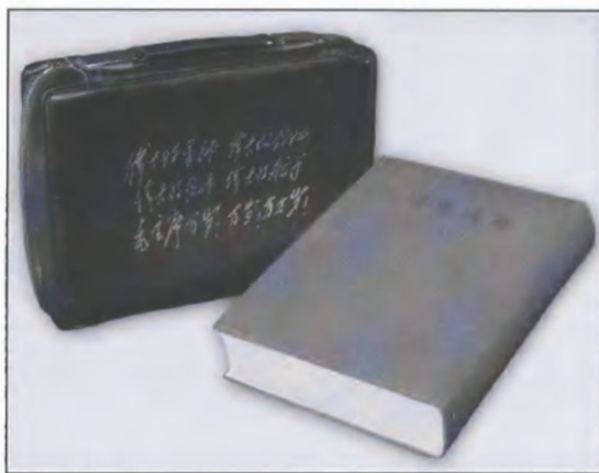
Bind 1 af Mao Zedongs udvalgte værker, der kan transporteres i en dertil indrettet plastiktaske fra 1966. Formodentlig fremstillet til rødgardister, som derved altid kunne have et udvalg af deres idols tekster hos sig.

Et trykt sæt på 19 blade udgivet i 1968 med illustrationer af Maos liv og gerninger, baseret på tofarvede træsnit, og er typisk for Kulturrevolutionen. Den kan betragtes som en slags tegneserie om rødgardisternes store idol: formand Mao (13×18,5 cm.) (Det Kongelige Bibliotek).