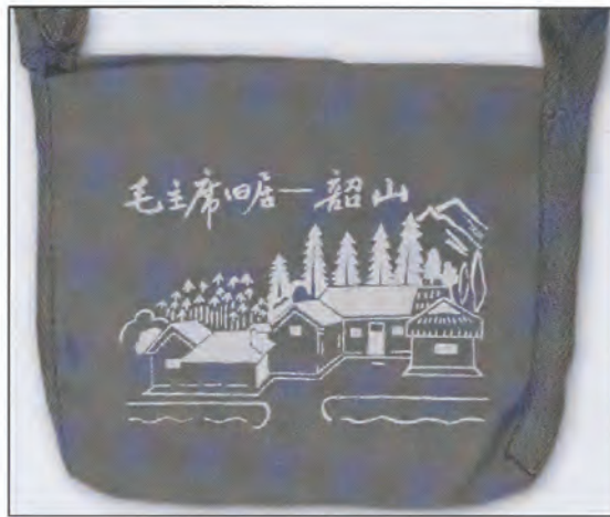
Lille rødgardistaske med motiv af Mao Zedongs fødebjerg i Shaoshan i Hunan provinsen, ca. 1968. Formodentlig beregnet til "Maos Lille Røde" (Det Kongelige Bibliotek).