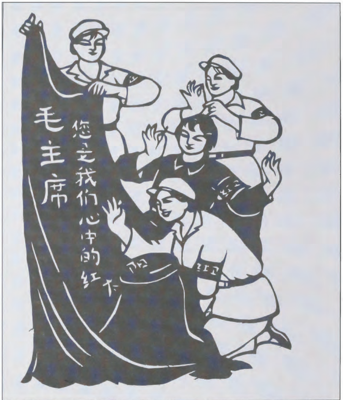
Papirklip med en gruppe kvindelige rødgardister, der syer en byldest til formand Mao på et rødt banner. Ca. 1968. (16,5x11,5 cm.)

Mao Zedong og Lin Biao på Tian'anmen, hvor de er på vej til at inspicere "Den Store Kulturrevolutionshær". Baseret på et farvefoto og udgivet i december 1967. (77x52 cm.)