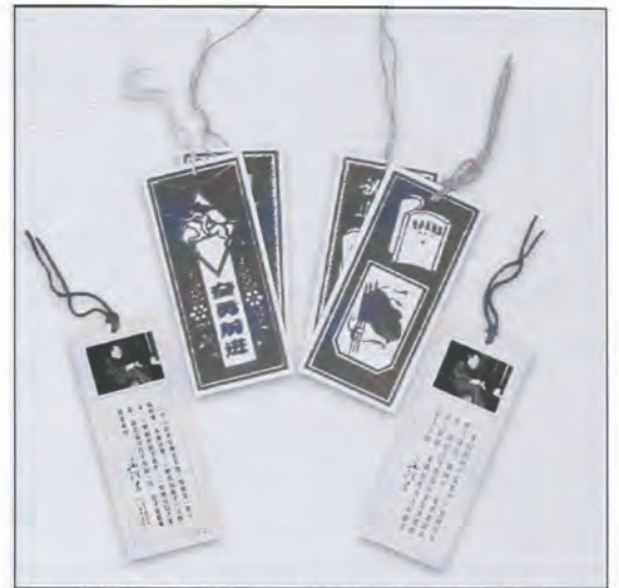
Bogmærker til læsningen af Mao Zedongs udvalgte værker. Det ene sæt på fire består af rødt fløj på hvidt papir. Udformningen minder om papirklip. Det andet sæt på to har et foto af en siddende Mao Zedong hver med et citat af Mao Zedong. Ca. 1970. (Ca. 9,5x4 cm.) (Det Kongelige Bibliotek).

Træsnit. Nytårstryk fra 1950 i traditionel form men med revolutionært indhold. På billedet fejres det første nytår i den kommunistiske stat med bønder i optog, hvor forskellige symboler på det nye styre stolt bæres frem, bl.a. portræt af Mao Zedong, Statsvåbnet og emblemet for det kommunistiske parti (Det Kongelige Bibliotek).