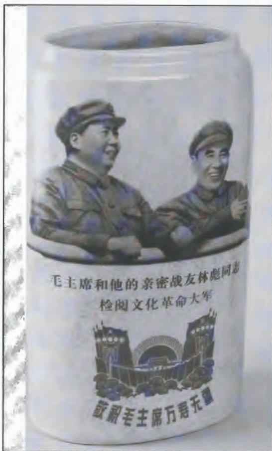
Vase med motiv af Mao Zedong og Lin Biao stående på portbygningen ved "Den Himmelske Freds Plads" i det centrale Beijing i forbindelse med et rødgardistoptog i 1966. Teksten under billedet hylder Mao og Maos tro følgesvend Lin Biao. Fremstillet i 1968. Højde 28 cm.

D a mange af de asiatiske sprog har alfabeter eller tegn, der er meget velegnet til at udforme i kalligrafiske udgaver, har afdelingen også købt kinesisk kalligrafi i et mindre omfang. Af den grund er der blevet erhvervet nogle kalligrafiske eksempler i kopi på Mao Zedongs håndskrift som f.eks. plakater med gengivelse af egne citater i kalligrafisk form og to tepotter fra 1965 med indgraverede kalligrafiske sentenser.