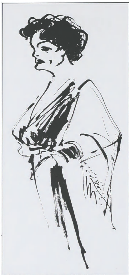
Skuespilleren Ghita Nørby, tegnet af Flemming Nyborg.

en lussing, så den høje hat røg af. Det var skuespilleren Robert Schyberg, som Edvard Brandes havde karakteriseret således i en anmeldelse: