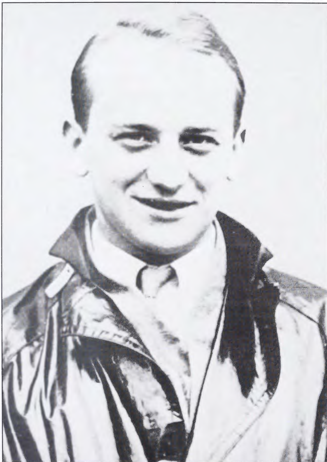
Knud Sønderby (1909-1966). Forfatter til romanen „Midt i en Jazztid“, der i dag opfattes som en moderne klassiker. Alligevel fik bogen en hårdhændet modtagelse af anmelderne i 1931, hvor bogen udkom første gang.