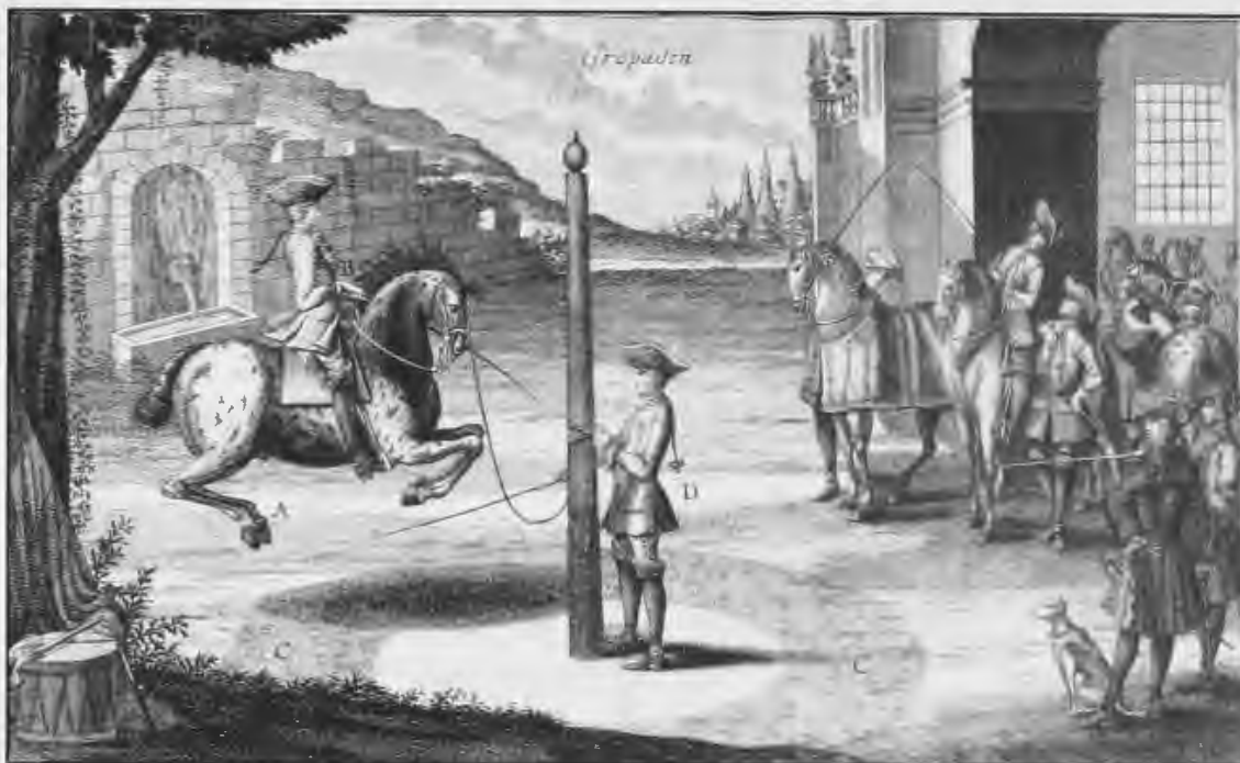
Groupade vist ved pilaren af rytter på en tigret hest. I Löhneysens ridebøger fra 1609-10, der med sandsynlighed var illustreret af forfatteren selv, findes ingen tigrede eller spættede heste på illustrationerne, men på den udgave, der kom i 1729 findes adskillige. Et eksempel på modens omskiftelighed i hesteavl. (Illustration fra Georg Engelhard Löhneysen: Neu-eröffnete Hof-Kriegs- und Reitschul. Nürnberg 1729).

en dansk og en spansk modsætning, men snarere en forstærkning af visse fælles gener, der sandsynligvis har haft en fælles oprindelse i Spanien. Bedækningen af Flæbehoppen resulterede 1813 i en spættet hingst, der efter sigende skal have haft 22 forskellige farver. Hingsten fik navnet Mikkel, og efter den er knabstrupperne også siden blevet betegnet som „mikkeler“. Desværre er denne hingst næppe nogen- sinde blevet malet eller tegnet, og vi kan derfor kun gisne om dens type og udseende, hvilket er ærgerligt, da man med nogen ret kan betragte den som stamfaderen til den moderne knabstrupperhest. Sin udholdenhed og hurtighed syntes den at have overtaget efter moderen, men man skal ikke være blind for, at også Bæverhestene i det 19. århundredes begyndelse gjaldt for at