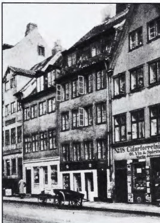
Borgergade. På kvisten i nr. 20, i huset bag trækvogn, boede H.C. Andersens søster.

Det blev sikkert ikke bedre efter moderens død senere på året. Dermed mistede Andersen den vigtigste kilde til halvsøsterens færden. Han var nu overladt til fantasiens gisninger, og på den baggrund digtede han romanen O. T. , der udkom i 1836. Titlen dækker over hovedpersonen Otto Thostrups initialer, som han har fået tatoveret på armen som barn. Men han opdager til sin store skræk, at de også kan fortolkes som Odense Tugthus, hvor han har tilbragt en del af sin barndom. Længe plages han af forestillingen om, at en tateragtig og dæmonisk pige, Sidsel, er hans søster, indtil det viser sig, at det i stedet er hendes store modsætning, den blide og æteriske Eva, som i øvrigt dør. O. T. var H.C. Andersens forsøg på at digte sig ud af sit traumatiske forhold til søsteren. Det lykkedes dog ikke. Selv om det sande søskendeforhold opklares til slut, frygter Otto Thostrup fortsat, at Sidsels fader, der er