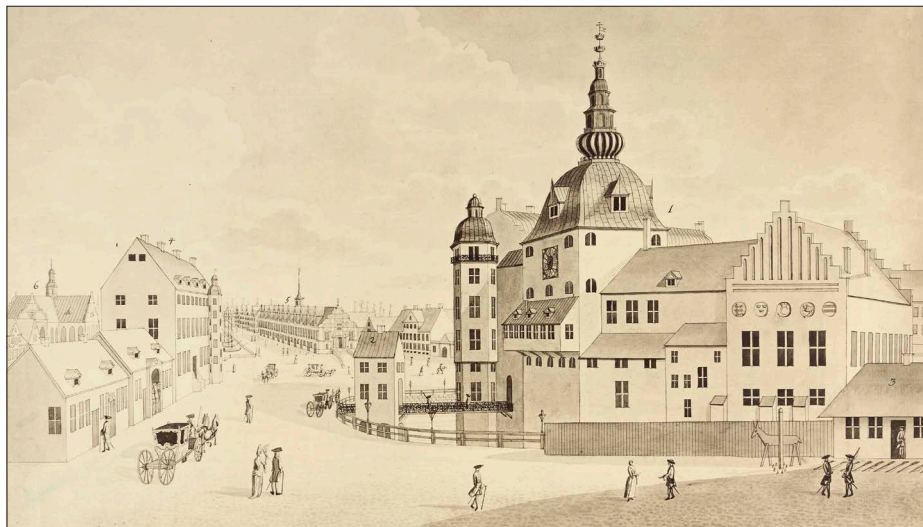
“Prospect af Det Kongel. Residentz-Slott i Kiøbenhavn at see fra Høibroe Anno 1698”. Vitruvius TAB. xxxv. Det Kongelige Bibliotek, Billedsamlingen.

tilbage til Hamburg fra Frederiksodde i 1657/58, til lægepraksis dér.