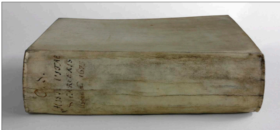
Otto Sperlings selvbiografi (1673), indbundet i lyst svineskindspergament (18 × 21,5 × 5 cm). Det Kongelige Bibliotek, GKS 3094 4 o

han i landskaberne og lagde mærke til, at klipperne af sand- og kalksten, der kunne indeholde skaller af havets dyr, bestod af lag. Han ræsonnerede om lagene, at de var blevet aflejret lidt efter lidt oven på hinanden, så at de nedre var ældst og de øvre yngst, og at sådanne bjergartslag kan blive slidt, f.eks. af vand, eller vippet, f.eks. ved jordskælv, hvorefter ny lag kan blive aflejret vandret oven på de forstyrrede lag. Herved opstår komplekse lagfølger. Stenos De solido fra 1669, der med en enkelt planche forklarer både det netop beskrevne superpositionsprincip og princippet om krystalvinklens konstans, regnes for et geologisk hovedværk. Dog blev 'geologi' ikke nævnt; ordet og begrebet var endnu ikke i brug.