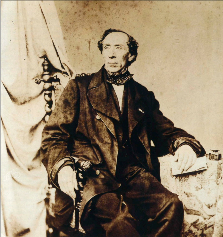
H.C. Andersen. München 1860.

risk genrebillede, der kunne have været foreviget af en af guldaldermalerne, da H.C. Andersen 28. maj 1859 læste op for kongen og grevinde Danner under en sejltur på søen omkring Frederiksborg Slot: "Skoven var sprunget ud, Veiret varmt og smukt, Kong Frederik den Syvende opholdt sig da paa det