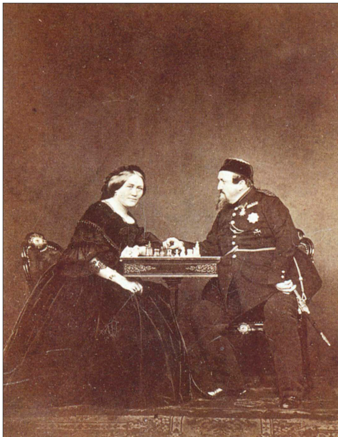
Frederik 7. og grevinde Danner ca. 1860. Visitkortfoto i H.C. Andersens foto- grafalbum.

Slot, 24 en begivenhed, som han desværre ikke kommenterer yderligere, men mon ikke tankerne er gået tilbage til barndommen og tøndeslagningen?