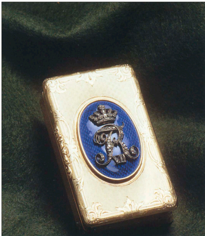
Gulddåse skænket H.C. Andersen i 1862 af Frederik 7.

gæsesteg på slottet, melder historien ikke noget om. Faktum er, at han gik tidligt i seng og sov elendig. Lagnerne var som håndklæder, de rullede sammen under ham, og det stak som en torn i – Andersen skriver ikke hvor. Læseren af dagbogen må selv gætte hvor. 25