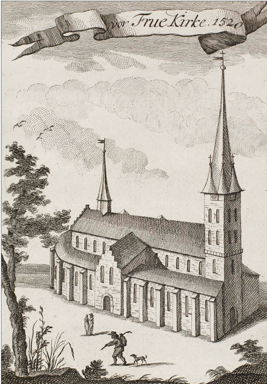
Sidekapperne i Vor Frue Kirke blev anvendt som boglagre for byens boghandlere.