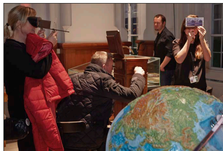
Kulturnatten 2014: Publikum ser på stereoskopbilleder.

Måske tænker man, at det kun er børnebøger, der indeholder sådant fjas, men Bevaringsafdelingen havde fundet smukke, gamle pop-up-bøger frem, der