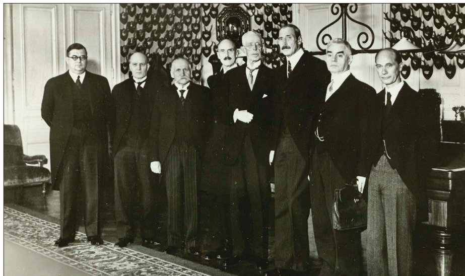
De tre nordiske konger og den finske president samt deres respektive udenrigsministre ved kongemødet i Stockholm den 18. oktober 1939. Det Kongelige Bibliotek, Billedsamlingen.