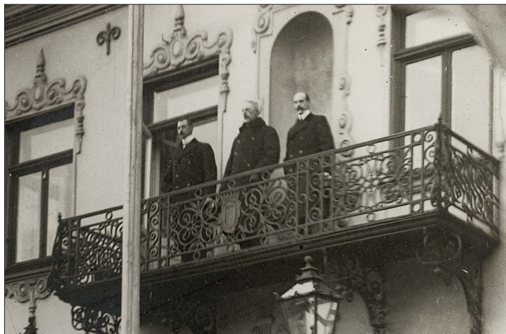
Tre konger på altanen under mødet i Malmö 1914.