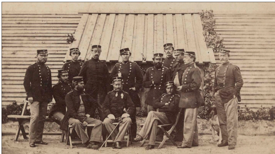
Det er ikke kun ødeleggelser; også de menige soldater blev gengivet af kameraet.