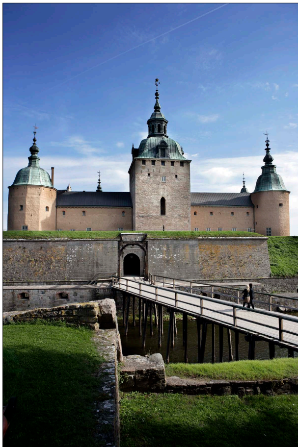
Kalmar Slot, hvor unionsaftalen blev indgået i 1397.