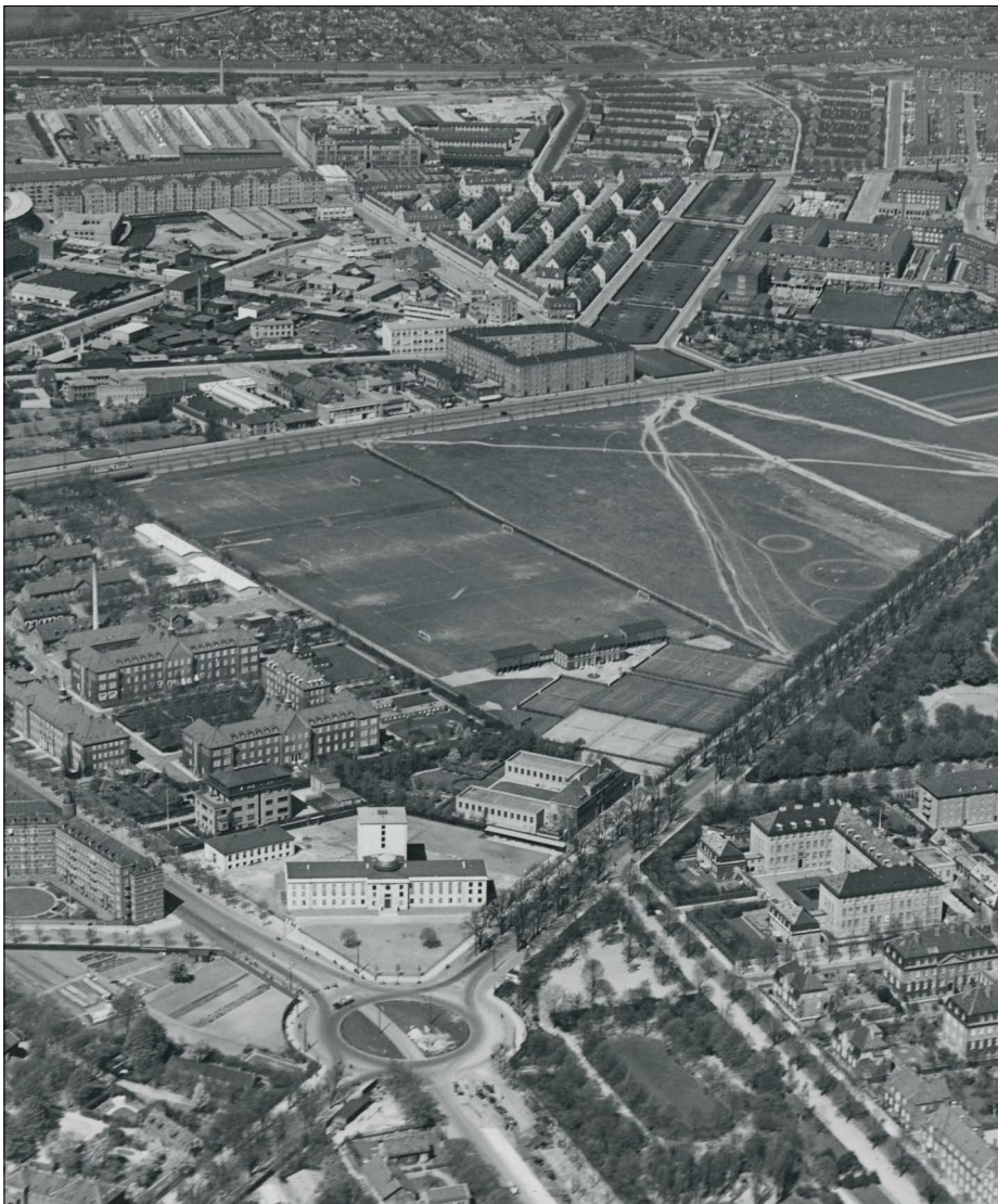
Luftfoto af et meget nøgent bibliotek foran Nørre Fælled, som i 1938 stadig er en bar mark.

“At flytte et Bibliotek af større Omfang er aldrig let. Men det er værre at flytte et halvt end et helt, og værst, naar Bøgerne yderligere skal opstilles efter nye Principper før Flytningen.”