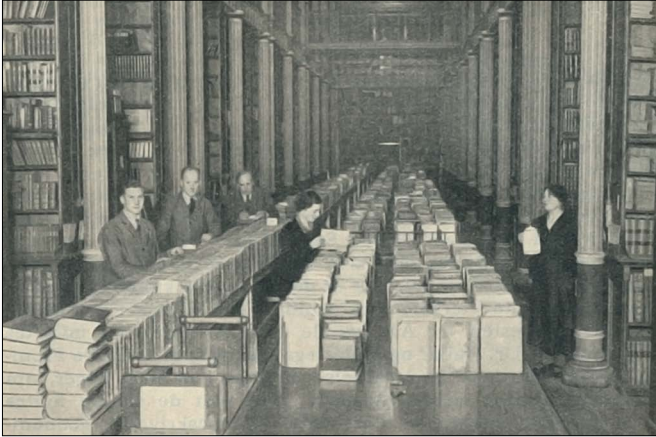
Bøgerne er linet op i det gamle universitetsbibliotek i Fiolstredet, klar til sortering og mærkning. Illustration fra Bogens Verden, 1938.

med stemplerne, mens andre udtog tidsskrifter “efter de alfabetisk ordnede Sedler”. Pladsen var trang, og montrer og borde blev hurtigt fyldt, men problemet mindskedes efterhånden som “al tom Reolplads” kunne tages “i Brug til dette Formaal.” Den meget deltaljerede og levende skildring af flytningen gav samtidig et indblik i tonen og stemningen under arbejdet, og Høyer berettede herom: