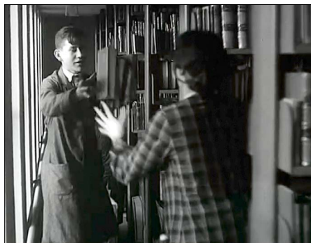
Bogkast. Still-billede fra reportagefilmen, som kan ses på < www.danskkulturarv.dk/dr/nyt-medicinsk-bibliotek >. Eller scan her:

Ovenstående beretning suppleres på glimrende vis også af ugerevyens reportage, hvor den fysiske flytning af bogmassen fra Fiolstræde til Nørre Allé skildres i ord og levende billeder: I vinduet i det gamle universitetsbibliotek står to ansatte, som er i færd med at rense og banke bøgerne fri for støv, før de flyttes i store kasser ned til det interimistiske træskur. Derfra bæres de ind i flytteomnibussen, vogn ”No. 5” med anhænger fra flyttefirmaet Transport Danmark . Ifølge speakeren, som har lagt lidt ekstra tal til historien, var der tale om en flytning af “ikke mindre end 300.000 bind, eller 7 km”, som “i løbet af 2 måneder” blev “overført til de nye bygninger”, hvis facader ses afbildet på filmen. Fokus rettes herefter særligt mod det for sin tid imponerende nye bibliotek og bogtårnet med dets i alt 10 etager. På 9. etage ses fire ansatte, som ser ud af tre åbentstående vinduer. Speakeren fortæller, at bogtårnet senere kan øges med “endnu flere” etager. Herefter ses flyttefolk, der bærer trækasser med bøger fra flyttebilen hen til