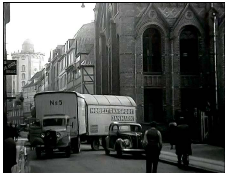
Flyttebilen svinger ud i Krystalgade. Still-billede fra reportagefilmen.

fylde Vogn ud i Krystalgade er et Kunststykke; navnlig i Dagene før Jul var gaden saa tilstoppet af parkerede og kørende Biler, Cykler og Trækvogne, at Politiet flere Gange maatte tilkaldes for at skaffe Passage. Den, der jævnlig som "Chaufførens Ven" kørte med ud til det nye Hus, krummede ofte Tærne i Forventning om et uundgaaeligt Sammenstød, men altid gled vi igennem, mens Chaufføren lod falde en Bemærkning om, at "her er saamænd god Plads", men han saa afgjort meget lettet ud, naar han havde faaet sit Vogntog navigeret ud i den mere farbare Nørregade, og hans Ledsager, der havde siddet med Livet i Hænderne, satte det atter paa Plads."