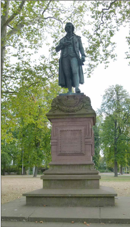
Schillerdenkmal fra 1876 i parken Schillerhöhe.

museumslande og havde et stærkt fokus på historieforskningen, hvilket foruden rent videnskabelige fortjenester var båret af en pengestærk og organisatorisk selvbevidsthed sammen med behovet for at legitimere, dokumentere og eksponere samlingen af de tysksprogede områder ved hjælp af historien. En klarere profilering af litteraturhistorien, tysk litteraturvidenskab og germanistik var en del heraf; modersmål og litterære klassikere var indarbejdet i undervisningen, samling af efterladenskaber og oprettelse af besøgssteder indgik i nationsopbygningen; den indflydelsesrige filosof og multihistoriker Wilhelm Dilthey – hvis fornavn også illustrerer den