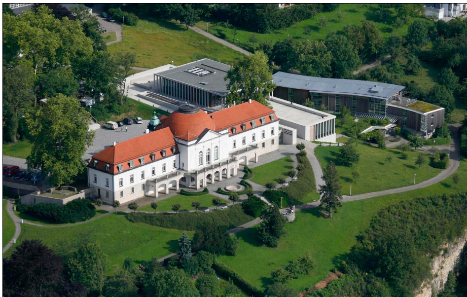
Schiller-Museum i Marbach: Forrest den historicistiske bygning fra 1903 og bagved Literaturmuseum der Moderne fra 2006. Selve arkivbygningen ligger til venstre, udenfor billedet.

1980'erne blev denne institution så via en ny tilbygning omdannet til et egentligt Schiller-Museum , således både en parallel til byens Goethe-Nationalmuseum som var etableret i Goethes tidligere bolig i 1885, og en østtysk Schiller-pendant til Marbach i vest. Med det delte Tyskland efter 1949 og Weimar-institutionerne beliggende i DDR var der tale om en splittelse af forvaltningen af den tyske litteraturarv – også trods eksempler på samarbejder.