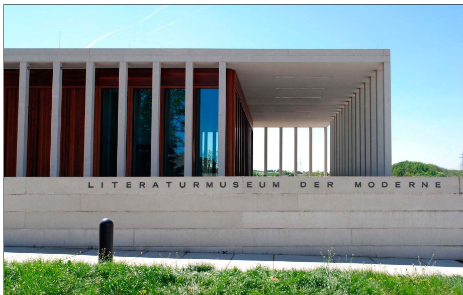
LiMo – Literaturmuseum der Moderne – har sin egen bygning, opført i 2006.

konsolidering af foreningsdannelsen og støttekredsen bagved, også med stigende offentlige tilskud; dertil føjedes enkelte tilbygninger og udvidelse af udstillingsfaciliteter med ajourførte formidlingsstanker. Arkivet og biblioteket i ét samlede sig med støt fyldigere erhvervelser (bl.a. forlagsarkiver) om et bredt litteratursociologisk syn på hele litteraturens livsbetingelser eller det litterære liv – produktion, distribution/formidling og reception; og med henblik på både forskning og bredere tilgængelighed satsede man mere på en tidsmæssig ajourføring sammenlignet med Weimararkivet. I 1980 fik institutionen opgaven med at koordinere alle litteratursamlinger, forfattermuseer, litterære besøgssteder etc. i hele delstaten Baden-Württemberg – et tidligt eksempel på en oplevelses- og kultur turistmæssig indsats. Forbindelsen til universitetsverdenen blev