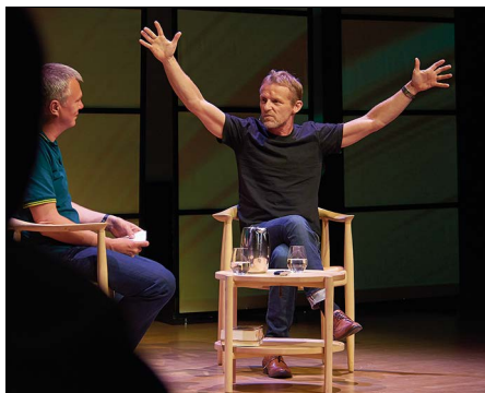
Jo Nesbø fortæller – med hele kroppen.

Alt dette og meget mere fik publikum svar på ved et livgivende arrangement i Dronningesalen.