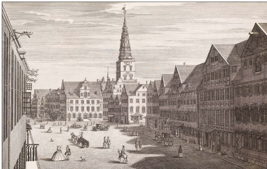
Et af hovedværkerne indenfor dansk bogkunst: Laurids de Thurahs Den danske Vitruvius, trykt af E.H. Berling i slutningen af 1740'erne. Bogen viser en lang række primært københavnske bygninger afbildet i datidens højeste stik- og trykkvalitet – her Amagertorv med Nikolaj Kirke i baggrunden.

prægtige højdepunkter fra mere end 500 års dansk bogproduktion. BOGKUNST er en slags kanon over bogfremstillingens kunsthåndværk i Danmark, som samtidig afspejler den almindelige kunsthistoriske udvikling i stilarter og genrer. Så ypperligt og lækkert, pragtfuldt og opfindsomt kan det gøres – inden læseren overhovedet har tilegnet sig et ord.