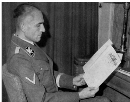
Werner Best havde sin helt egen politiske linie, uafhængig af diktaterne fra Berlin, hvilket stod klart igennem forårets foredragsrække.

Foranlediget af kildeudgaven, der udkom i september 2012, Werner Bests korrespondance med Auswärtiges Amt og andre tyske akter vedrørende besættelsen af Danmark 1942-1945 , har biblioteket arrangeret en foredragsrække her i foråret, hvor fremtrædende besættelsestidsforskere sætter deres egen forskning i perspektiv i forhold til den store mængde nye viden om politikerne Werner Best, som kildeudgaven har afstedkommet.