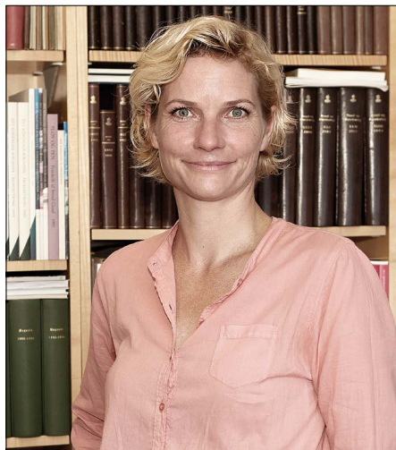
Pernille Drost i sit nye habitat; Det Kongelige Biblioteks direktionsgang.

“I vores søgen efter en ny nationalbibliotekschef og vicedirektør ledte vi efter en dynamisk og strategisk begavet person med både gennemslagskraft og evne til at etablere gode samarbejdsrelationer inden for og uden for Det Kongelige Bibliotek. Med valget af Pernille Drost har vi fundet en person, der til fulde opfylder disse krav og evner at begå sig i mange forskellige faglige og politiske miljøer. Pernille Drost er tillige en faglig og ledelsesmæssig