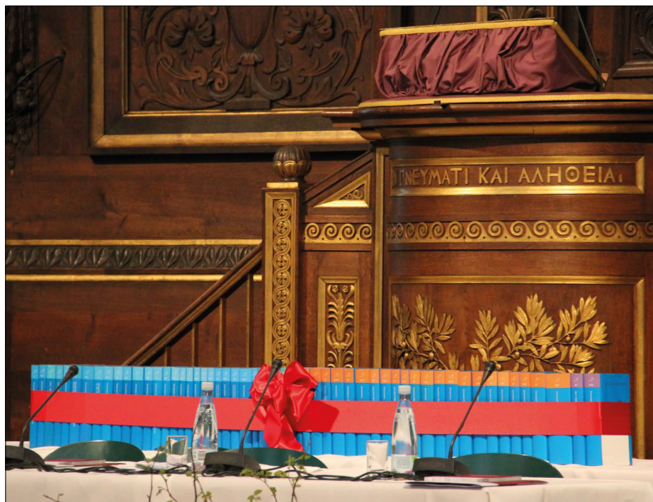
Udgaven i al sin pragt: De tilsammen 55 bind stillet op i Universitetets festsal i forbindelse med overdragelsen den 2. maj.

at kunne takke den fond og de ministerier, som primært har støttet arbejdet: Først Grundforskningsfonden, som søsatte projektet, og siden Ministeriet for Videnskab, Teknologi og Udvikling og Kulturministeriet, som har gjort det muligt at afslutte dette, Danmarks største humanistiske forskningsprojekt til dato.