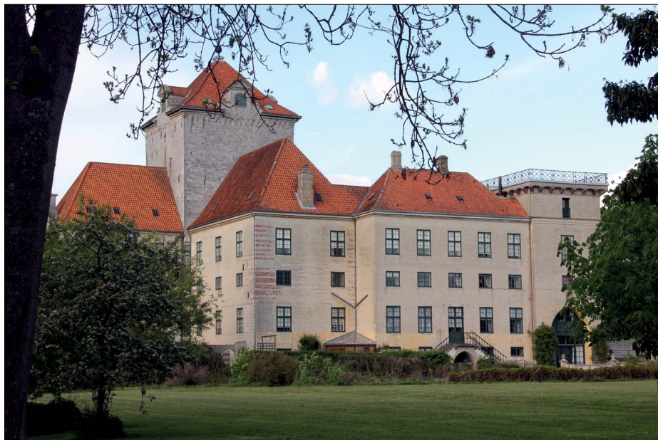
Gjorslev slot.