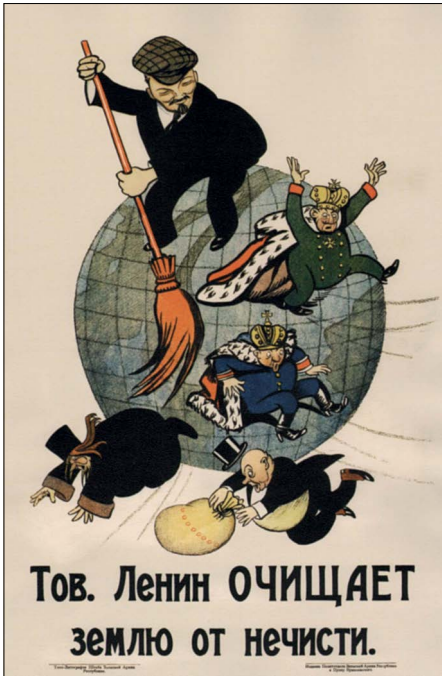
Klassisk agitprop: 'Kammerat Lenin renser verden for skarn'. Verdensrevolutionen i russisk plakat af Victor Deni, 1920.

inklusive de fleste bolsjevikker – var nu, at der ventede et længere kapitalistisk mellem spil, før tiden var moden til en socialistisk revolution på hjemlandets grund. Men Lenin insisterede i stedet på, at den revolutionære proces uden tøven skulle drives videre fremad mod en hurtig omvæltning i socialismens navn og med bolsjevikkerne selv som den ledende kraft. Hans forventning var netop, at en sådan ny revolution nærmest øjeblikkeligt ville sætte resten af det krigstyngede europæiske kontinent i politisk brand. Eller som han selv med ukuelig optimisme udtrykte det: “Hele det proletariske Europa vil være på vor side”.