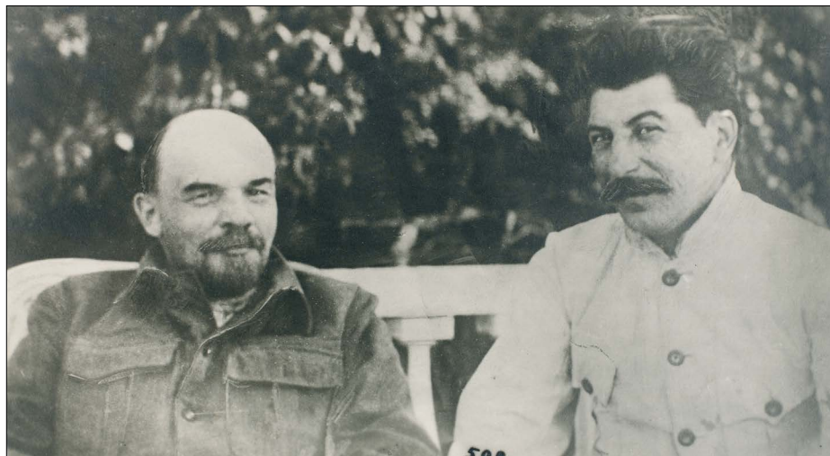
Good Guy & Bad Guy? – Eller to kedelige karle? Lenin sammen med sin efterfølger, Josef Stalin (1878/79-1953).