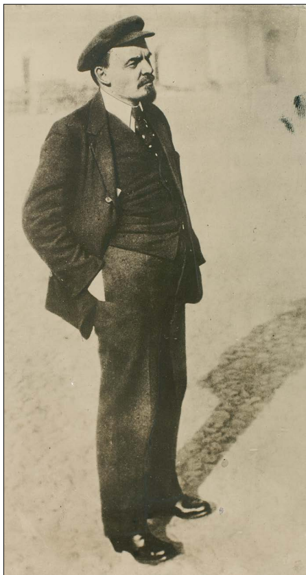
Vladimir Iljitj Uljanov (1870-1924) – bedre kendt under dæksnavnet Lenin – kastede lange skygger ind over det 20. år- hundrede.

foldede sig hovedsagelig ud inden for de ret snævre revolutionære russiske emigranter og sad i lange perioder som en anden stuelærd og granskede teori og filosofi på Europas førende biblioteker.