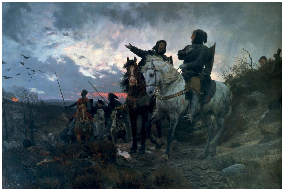
Næppe historisk korrekt, men alligevel et af de mest berømte danske historiemalerier: Otto Baches 'De sammensvorne rider fra Finderup efter mordet på Erik Klipping Skt. Cæcilienat', 1882. Det Nationalhistoriske Museum, Frederiksborg.

demar 2. Sejr havde forsøret sine yngre sønner ved at give dem len (den ældste var blevet medkonge). Var der ikke tale om et arveligt len, kunne lensherren ved vasallens død inddrage lenet. Det samme gjaldt, når en ny lensherre tiltrådte styret; men i begge tilfælde var forudsætningen den nødvendige magt.