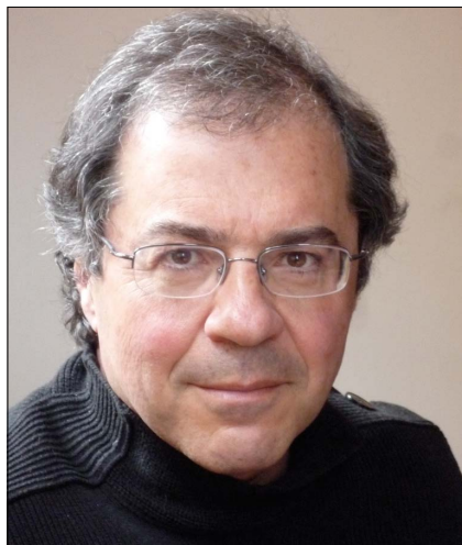
Vinder af Augustprisen, Göran Rosenberg.

Rosenberg beskriver i bogen, hvordan han rejser rundt i Tyskland og finder de tilgroede steder, hvor godsvognene gjorde ophold; han beskriver den angstelige stemning i Sverige efter krigsafslutningen og holdningen til de jødiske flygtninge, og han skriver med romanens lysende kraft. Med sin helt personlige stemme løfter Rosenberg denne veldokumenterede fremstilling ud over det dokumentariske. Et kort ophold er også memoirer – forfatterens bog om at genopdage den dreng, han var engang, da han voksede op i Södertälje.