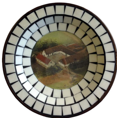
Askebæger med foto af gård. Fra udstillingen.

Dronningesalsmontrene, 28. februar til 31. marts.