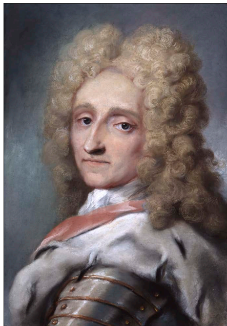
Frederik 4. (1671-1730) blev konge som 18-årig i 1699. Pastel fra 1709 af Rosalba Giovanna Carriera. Det Nationalhistoriske Museum på Frederiksborg Slot.

Moderne historievidenskab er langt hen ad vejen enig med Holberg i hans vurdering af den enevældige dansk-norske stat som en velorganiseret “magtstat” (militærstat) med en politisk ledelse, der fokuserede snævert på militær råstyrke og de til dette formål nødvendige organisatoriske og fiskale midler. Særlig har historikerne delt Holbergs vurdering af Frederik 4., som han i dedikationen af Dannemarks