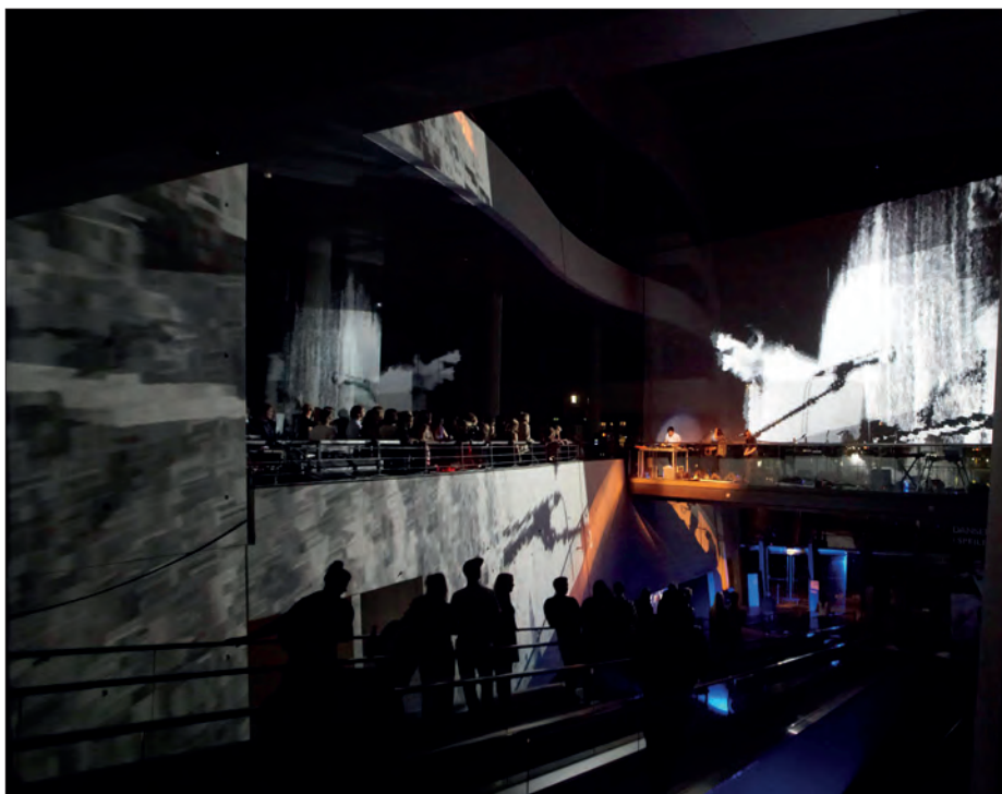
Stemmingsbillede fra Students Only! Semesterstartsfest 7. september 2012.