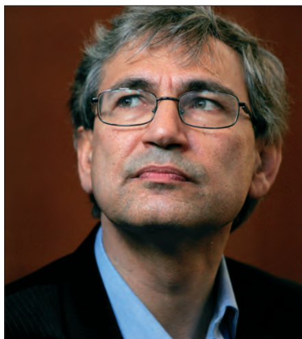
Orhan Pamuk – nu også museumsinspektør.

Orhan Pamuk gæstede København i oktober i anledningen af overrækkelsen af Sonningprisen. Han er kritisk intellektuel, politisk kontroversiel og Nobelpristager og han har i Istanbul grundlagt