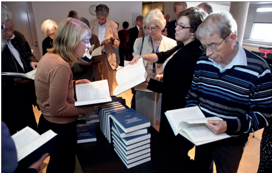
Tilhørerne studerer tibinds-kildeudgaven efter festtalerne i "Blixen".

For at tilgodese historiestuderende, som ikke har mulighed for at erhverve hele udgaven, vil biblioteket i begyndelsen af det nye år udgive den videnskabelige indledning sammen med en række nyttige tillæg i en simpel etbinds udgave.