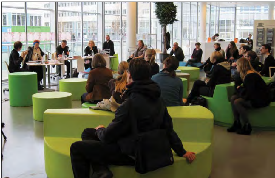
Indenfor i Det Humanistiske Fakultetsbibliotek.

TRAMS (Transnational and Migration Studies). Dette samarbejde førte som en sidegevinst til, at Paul Auster blev tildelt titlen “Æres-alumne” ved en festligholdelse på Københavns Universitet.