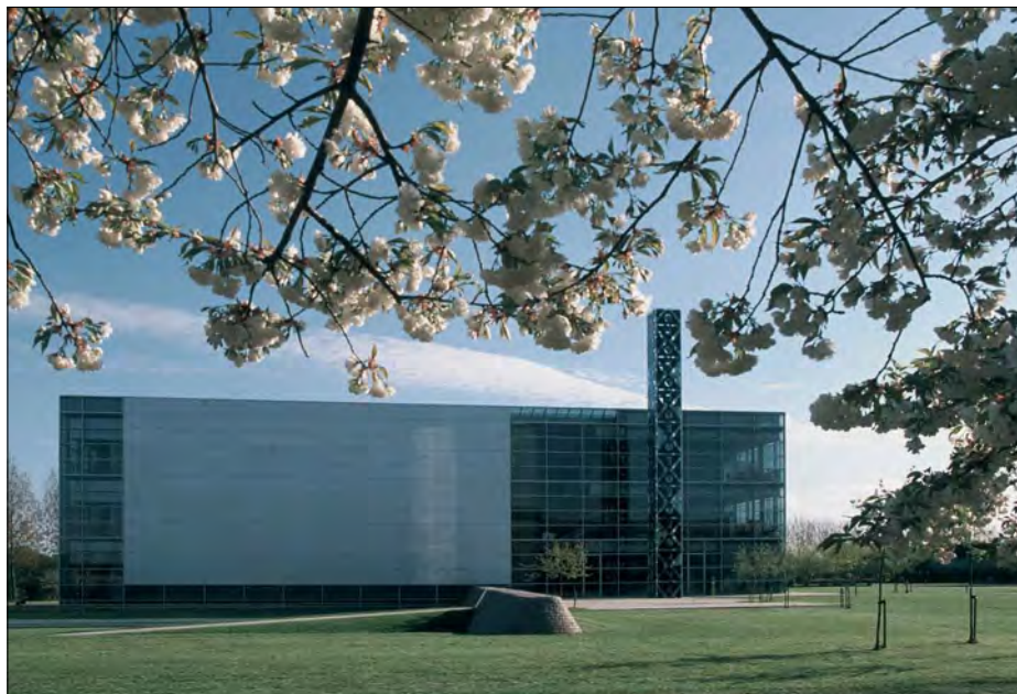
Det Humanistiske Fakultetsbibliotek, Njalsgade. Første etape blev indviet i maj 1998, og sammen med anden etape er det samlede areal 13.300 m 2 . I publikums-arealerne er der indrettet knap 500 læsepladser. Bygningen ligger ud til det centrale universitetstorv. Arkitekter er Dissing+Weitling.

måde, der udfordrer vanetænkning og giver en begrebsmæssig fleksibilitet. Overalt hvor mennesker interagerer skabes der læringsrum, og i liT.house arbejdes med litteratur som begreb, idé, kundskab, orden, dannelse, arv – ja endog som problem og illusion.