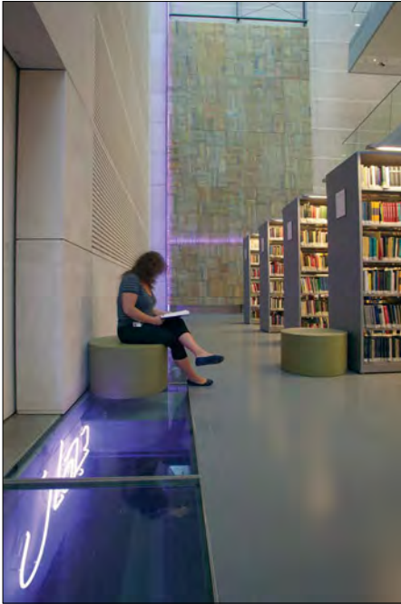
Interiør fra Det Humanistiske Fakultetsbibliotek.

om fokus kan forblive på et værks litteraritet, når nettet udfordres som medie, når grænsen udviskes mellem sprog og f.eks. visuel kunst og musik.