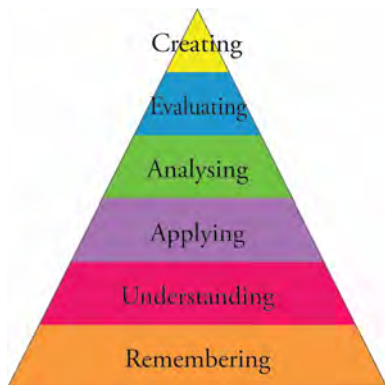
Blooms taksonomiske niveauer.

digital tidsalder har vi også et behov for at komme om på den anden side af bloggen for at høre det levende ord fortalt af levende mennesker, det er The Moth 11 i New York et godt eksempel på, hvor helt almindelige mennesker stiller sig op på scenen og fortæller deres egen historie. Alle har en historie at fortælle, og mens historien fortælles er den fortællende og den lyttende på magisk vis forbundet, fordi vi har et narrativt begær, som tilfredsstilles når fortællingen ”forstyrres” os, bringes os momentant ud af en form for balance, drevet af ønsket om at få at vide hvordan historien slutter. Som Jonathan Culler har formuleret det: “to tell a story is to claim a certain authority, which listeners grant”. 12