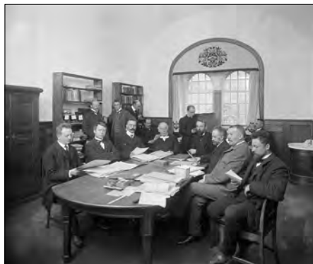
Det Kongelige Biblioteks frokoststue, 1906.

Alt dette er endnu i sin vorden, og det kræver videreudvikling af det eksisterende programmel, indgåelse af aftaler med leverandører og en ny måde at håndtere budgettet på. Siden november 2011