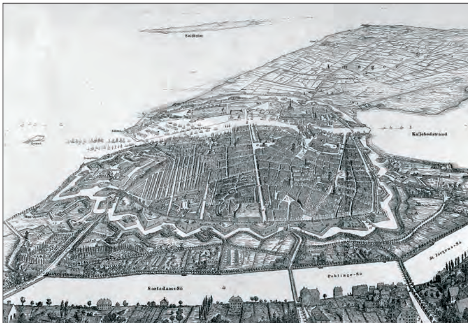
København i fugleperspektiv ca. 1851-70. Det var ingen stor by.

gaard var politiseringen bedrøvelig, og han bekæmpede den igennem hele sit forfatterskab, der gjorde kristendom til kulturkritik. At det gik, som det gjorde, var bestemt ikke noget, Kierkegaard brød sig om. Demokratiet var, skrev han under pseudonym i Afsluttende uvidenskabelig Efterskrift fra 1846 ”den meest tyranniske Regjeringsform”, for den “forpligter Enhver til positiv Deeltagelse”. 4 Skal man formulere det venligt, kunne man sige, at Søren Kierkegaard, som alle sande gentlemen, kun forsvarede tabte sager. Men også de tabte sager – den store modstand mod demokratiet ikke mindst – er vigtig at få med i billedet af guldalderen. De godtgør, at forholdet mellem de forskellige guldaldre – den litterære, den religiøse og den politiske – var ét, der slog gnister.