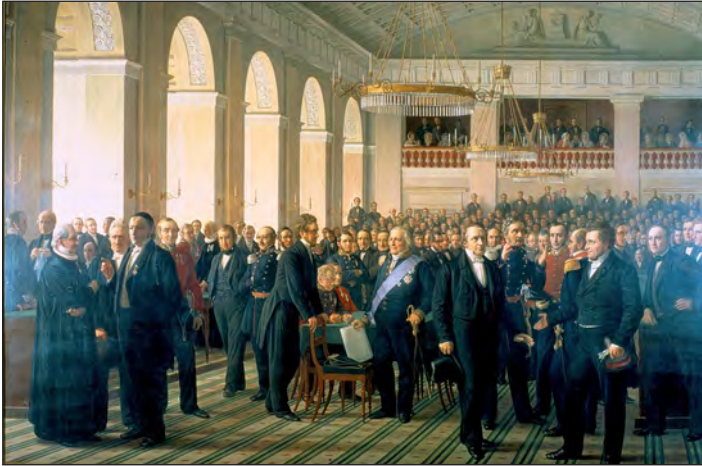
Den Grundlovgivende Rigsforsamling behandlede og vedtog Junigrundloven af 1849. Den første Grundlov blev underskrevet 5. juni 1849 af Frederik 7., hvormed styreformen i Danmark ændredes fra enevælde til konstitutionelt monarki. Maleri af Constantin Hansen, 1861-1865. Frederiksborgmuseet.

andet i guldalderen. Men det gjorde der. Grunden bliver i guldalderen lagt til Danmarks nuværende styreform. Det er i de år, at man begynder at tage skridt i retning af enevældens afskaffelse og folkestyrets indførelse, stadfæstet ved Junigrundloven af 1849.