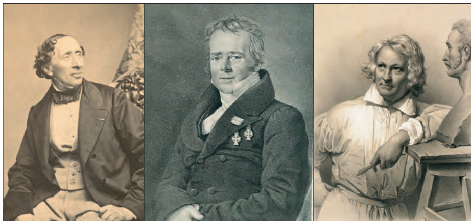
Tre danske verdensberømtheder i guldalderen: H.C. Andersen, H.C. Ørsted og Bertel Thorvaldsen.

nemlig eksistentialismen. Det er et oplagt eksempel på det efterliv, som guldalderens lokale litterære begivenheder har fået – ikke bare i Danmark, men worldwide . Det gælder i indlysende grad også H.C. Andersen, som Søren Kierkegaard indledte sin forfatterkarriere med at mobbe – med omfattende litterære konsekvenser.