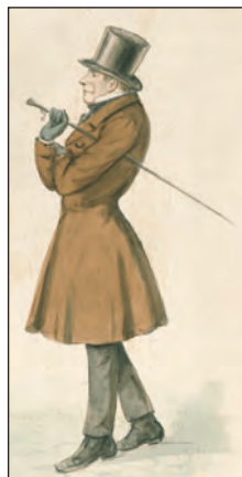
Søren Kierkegaard (1813-1855), tegnet af Peter Klæstrup.

samtiden præget af anticipationer, fore-