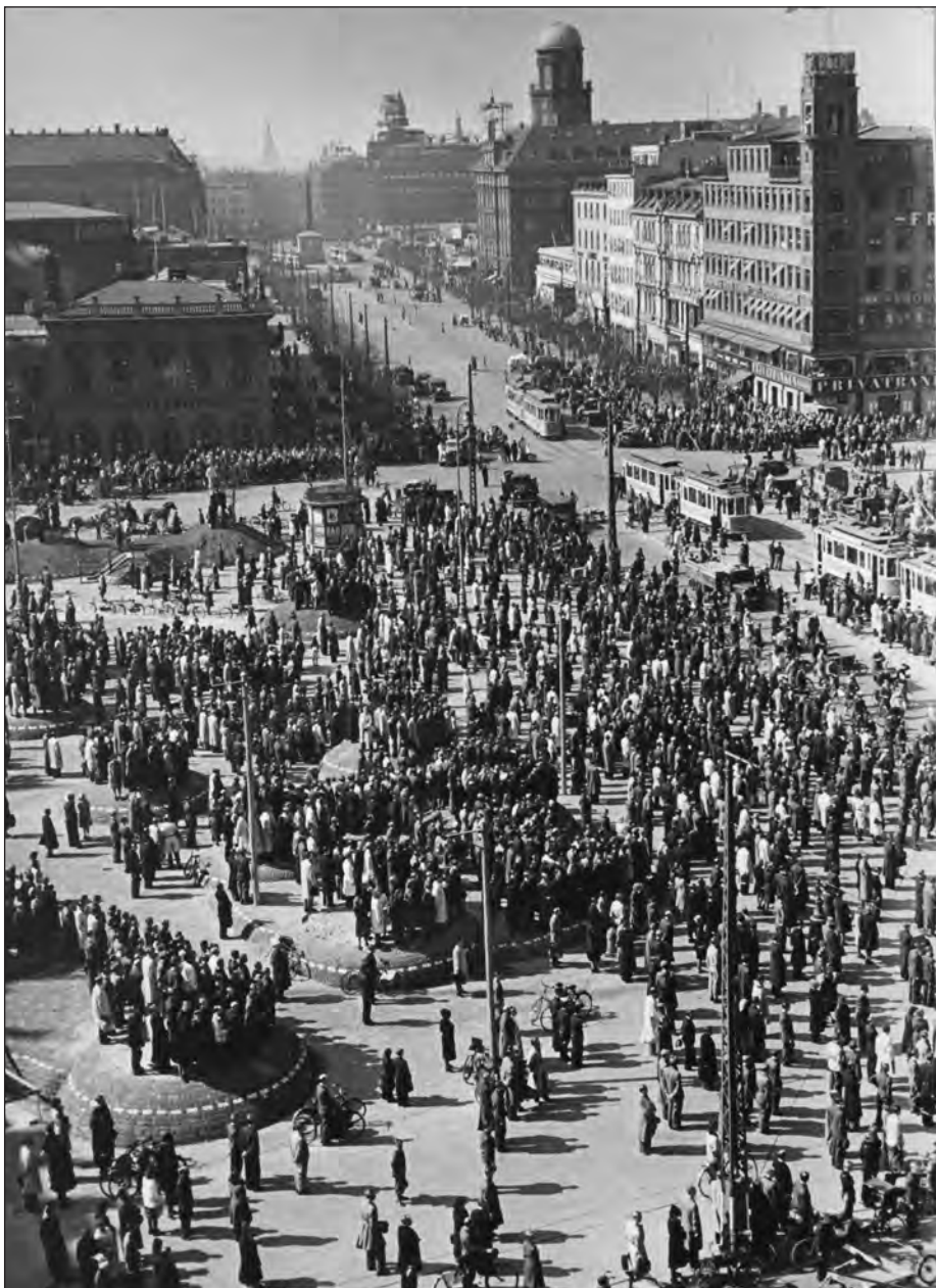
Rådhuspladsen i København 9. april 1945 klokken 12 middag (dagbogen ved s. 69.102). Ingen bevægede sig i to minutter bortset fra en bil med HIPO-folk, der søgte at forstyrre demonstrationen.