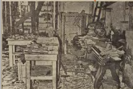
Det ødelagte Værksted i Maskinfabrikken i Ryesgade.

Sabotage-Forsøg i københavnske Virksomheder de sidste Dage Skindestykke bortsprængt ved Svanemøllens Station