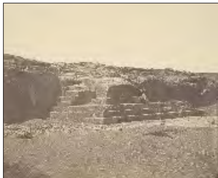
Phyx er en bøj i Athen, vest for Akropolis. Her mødtes den athenske folkeforsamling 40 gange om året for at drøfte statens anliggender og tage beslutninger – ved håndsoprækning –, og på de flade sten er der blevet talt af Perikles, Aristides og Alkibiades. Og her holdt Demosthenes sine flammende taler mod Philip af Makedonien. Folkeforsamlingerne fandt sted hér ca. 508 - 330 f.v.t. Tidligere blev folkeforsamlingerne afholdt på agoraen. Fotoet viser trappen til talerstolen.

D emokrati som styreform og som ideologi har en lykkelig balance mellem lærdom og tilgængelighed. Den er en synlig krone på mange års fokuseret forskning. Dit udgangspunkt var klassisk filologi og historie, hvor du hurtigt zoomede ind på det politiske system i den græske polis . Det emne har du studeret og undervist i, og ikke blot i Danmark. Du har været velkommen mange steder i verden som gæsteforsør, som oplægsholder til konferencer,