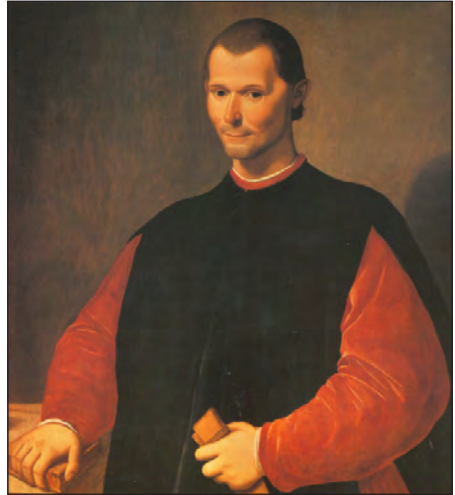
Niccolò Machiavelli (1469-1527) var en florentinsk forfatter, filosof, historiker og politiker. Han er først og fremmest kendt for det politiske skrift Fyrsten, udgivet efter hans død. Maleri af Santi di Tito; Machiavelli er klædt i sit embedstøj som sekretær i den florentinske administration.

E n central figur er Machiavelli, der ikke blot gav onde, men gode råd til fyrsten. Han gik også ind for et aktivt borgerskab, hvor rigdom spiller en mindre rolle end ære og loyalitet, og hvor hver borger er parat til at sætte hensyn til sig selv lavere end hensyn til det almene vel. Et godt samfund afhænger af borgernes kvalitet. De skal ikke blot være lydige, men også loyale, så de er villige til at forsvare staten. Kun loyale borgere er gode soldater, mens lejede hære er illoyale og til fals.