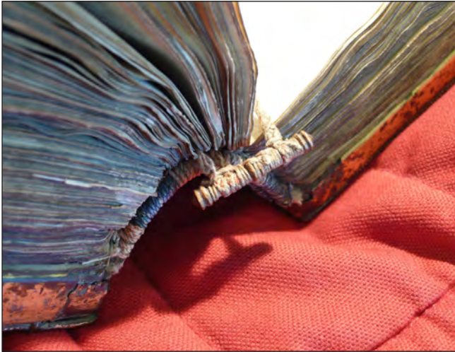
Bogmærket i Dalbybogen. Dalby i Skåne var bispesæde en kort periode fra ca. 1060. Fra klosterbiblioteket stammer Dalbybogen, et evangeliebåndskrift fra slutningen af 1000-tallet og dermed Nordens ældste (Det Kongelige Bibliotek).