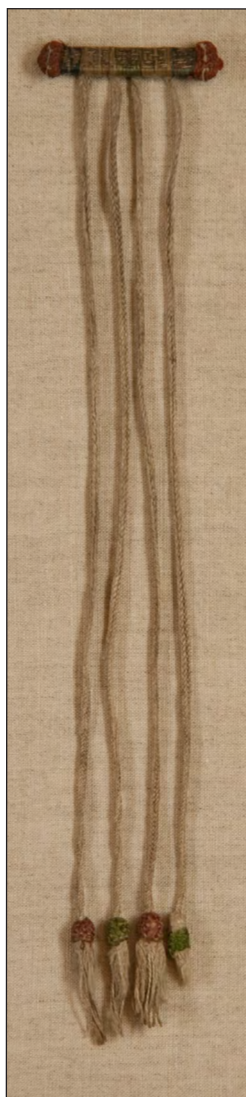
Bogmærke fra Wienhausen.

somme struktur, som snorene på bogmærket i Dalbybogen. Klostret i Wienhausen er øvrigt i besiddelse af hele tre flerstrengede bogmærker fra senmiddelalderen, de to andre er henholdsvis ét med en dekorativ knude med fire flettede snore af hvid hør og ét bestående af en oval silkepude