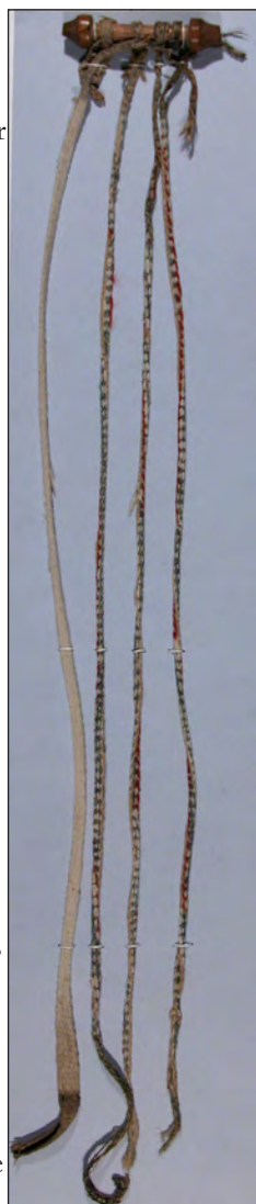
Bogmærke fra Weimar.

Flere af disse bogmærker er bemærkelsesværdigt velbevarede, da de konstant har siddet i den bog, de hørte til. Bogen har beskyttet dem mod lys og støv. Ofte er enderne, som har hængt uden for bogen, mere medtagne og snavsede. Ændringer i skikkene har beskadiget denne del af bogmærkerne; de var forholdsvis uberørte dengang bøgerne blev opbevaret liggende, men de udhængende dele blev let beskadiget, når bøgerne skulle stå på højkant. Langt de fleste bevarede bogmærker af denne type findes i forbindelse med bøger, som har tekstile, dvs.