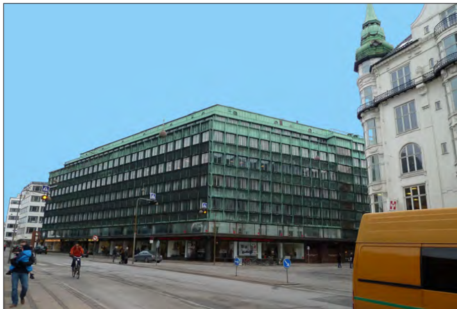
Kontorhuset "Vesterport", beliggende mellem Vesterbrogade og Gammel Kongevej. Opført i 1931-32 af arkitekterne Ole Falkentorp og Povl Baumann, og var for sin tid nyskabende både hvad angik dens konstruktion og funktion. Bygningen tjente som et kontorhotel, hvor det var muligt at leje kontorarealer. Blandt lejerne var gennem flere år nogle af Kominterns hemmelige støtteorganisationer, der var camoufleret som det fiktive firma "A. Selvo & Co." (Wikipedia, Jens Rost).

Stalinismens hemmelighedskræmmeri er efter min mening et godt eksempel på, at der hele tiden lige som er nye skjulte lag, man som forsker kan afdække. Vi ved i dag en hel del om det hemmelige system. Men vi ved også, at vi endnu ikke er trængt helt ind i hemmelighedskræmmeriets kerne. Der er stadig nogle opgaver, der venter på at bli-