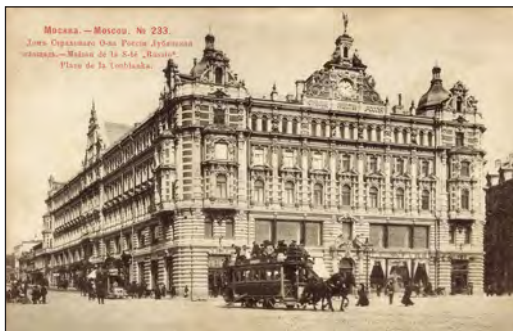
Terrorens kommandocentral. Det sovjetiske hemmelige politis hovedkvarter Lubjanka. I mange år (1926-1990) ved pladsen foran bygningen Dzerzjinskij Pladsen efter grundlæggeren af det hemmelige politi, Feliks Dzerzjinskij.

dens eksistens er nævnt i åbne kilder. Dens opgave er på det mere tekniske plan at varetage alt hemmeligt arbejde i det samlede sovjetsystem – konspirationsreglernes udformning og overholdelse, krypteringssystemernes indretning, det løbende kodearbejde, sikkerhedsgodkendelsen af det involverede personel samt – ikke mindre væsentligt – opsporingen og brydningen af fremmede magters kodekommunikation. Den er med andre ord en slags udøvende arm for folkene i Den Hemmelige Afdeling og Den Særlige Sektor og står da også i ekstraordinær tæt forbindelse med netop disse partikontorer. Mens det på Gammel Torv og i Kreml for det meste gælder arbejdet på det mere overordnede niveau, trækker det hemmelige politis Specialafdeling læsset, når det kommer til alle hånde konkrete detaljer.