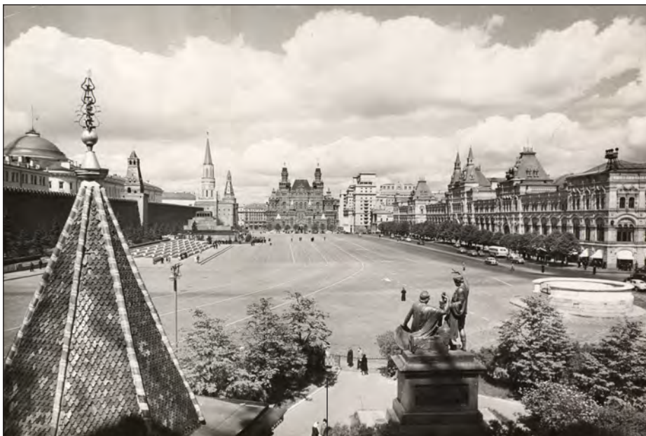
Moskva, Den Røde Plads. Bag muren til Kreml (t.v.) ses Senatsbygningen, der bl.a. husede det kontor, hvor Stalin i stigende grad isolerede sig, som årene gik. Foruden Kommunistpartiets Politbureau holdt også sovjetregeringen sine møder i Kreml.

ningshemmeligheder, der er fortrolighedsklausuler, der er tavshedsløfter. Og så videre. Og så videre. Nu skal man heller ikke overdrive de totalitære regimers særpræg sammenlignet med andre systemer.