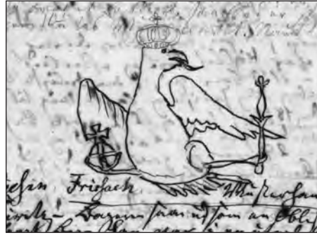
H.C. Andersen: Tegning i Dagbog paa en Tydsklands Reise 1831. Den Collinske Manuskriptsamling (Det Kongelige Bibliotek).

”I broget Mangfoldighed findes her ikke blot Udkast, Kladder og Renskrifter til hans Digte, Skuespil, Romaner, Eventyr og Rejsebeskrivelser, men ogsaa Karakterbøger, Stile og Optegnelser fra Skoletiden, de første primitive poetiske Forsøg, Ansøgninger og Anbefalinger, udførlige Dagbøger og Almanakker med korte Notitser, Stam-