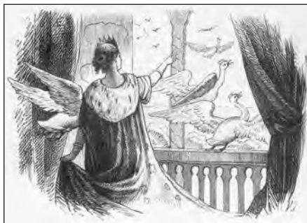
Illustration til "De vilde svaner" af Vilhelm Pedersen. Eventyr, fortalte for Børn. Ny Samling. 1838-42.