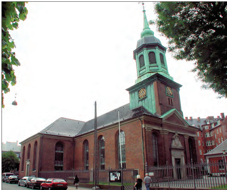
Garnisons Kirke. Kong Frederik IV var byggherre, og kirken stod færdig i 1706 som hærens kirke i København, der som udpræget fæstningsby rummede en stor landmilitær garnison. Kirken ligger på langs ad Sct. Anna Plads og syner udvendigt ikke af så meget. Men indvendigt folder den sig ud som et af byens største og mest monumentale kirkerum.