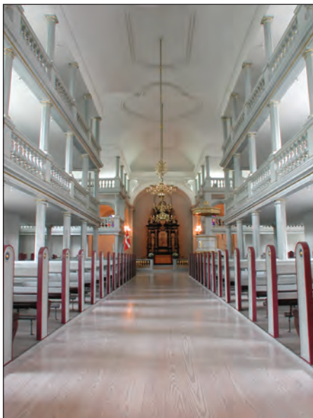
Garnisons Kirke med de to pulpituretager langs væggene.

senere, den 14. januar 1740, skulle forklare sig over for Kirkekollegiet, 5 der ved siden af sine censurforpligtelser havde til opgave at holde opsyn med rigets religiøse tilstand, herunder præster, der ikke artede sig.