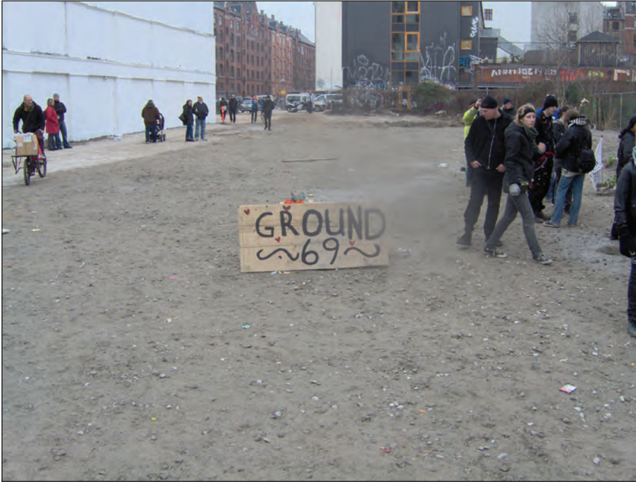
"Ground 69" – Jagtvej 69 efter nedrivningen af Ungdomshuset.

Strawberry Fields Memorial, som er et en hektar stort område i Central Park lige neden for Dakota-bygningen. En cirkelrund kompasroseagtig mosaik danner centrum, og på den står ordet "Imagine", der er titlen på Lennons største solohit. Der samles folk på hans fødsels- og dødsdag under former, der minder ikke så lidt om en slags moderne, popkulturel helgenkult. Hvad er det, som her mindes? Det er ikke nemt at sige præcis, og det er også et vigtigt kendetegn ved erindringssteder, at de ikke er skarpe i konturerne, men mangetydige og mildt sagt fleksible. Man går dog næppe fejl, hvis man mener, at Strawberry Fields er et erindringssted for hippiekulturen i bred forstand, både æstetisk og politisk, men med tydelig overvægt af "peace,