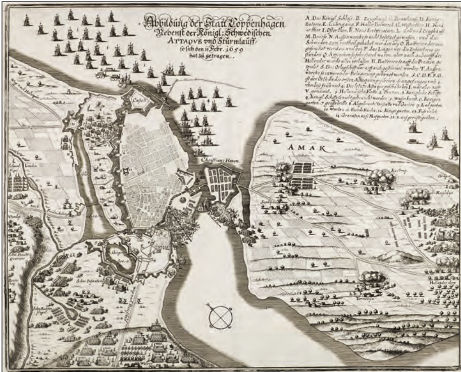
Stormen på København 1659. Kobberstik fra Theatrum Europæum bd. VIII (1693).

februar 1659, er også i sig selv en spændende historie. Det er midt under sven- skekrigene 1657-60, og svenskerne har siden august 1658 belejret København. Rent militært er der tale om dødvande, fordi en hollandsk undsætningsflåde i slutningen af oktober 1658 brød den svenske blokade fra søsiden og styrkede forsvaret. København var vel befæstet og bemanded og i øvrigt også varslet om det kommende angreb. Svenskerne havde ikke forberedt sig ved at gøre et bestemt punkt af fæstningen mørt, sådan som det ellers var almindeligt forud for et stormangreb. Stormen var militært set derfor et hovedløst foretagende, dømt til at mislykkes, og at den overhovedet