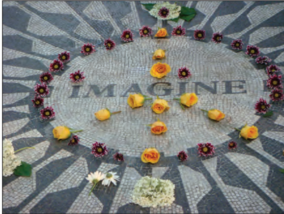
Strawberry Fields Memorial.