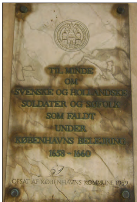
Mindepladen i Stormgade opsat 1959.

Men denne plade er så sandelig også på det nærmeste et anti-mindesmærke. Den er nemlig ikke et minde om selve stormen endside den danske sejr, men en mindeplade for de svenske og hollandske soldater og søfolk, der døde under belejringen. Kort sagt: Alle identitetsskabende bånd mellem selve begivenheden og det kollektiv, der opsætter mindesmærket, er borte. Der er intet budskab, ingen identitet, ingen patos, kun nøgtern og helt korrekt historisk oplysning. Historien (i Noras betydning) har sejret over erindringerne.