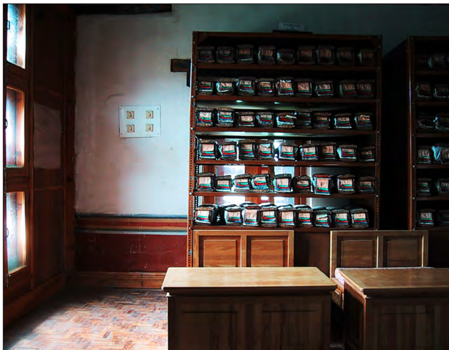
Bag vinduet: Reol med bloktrykte tekster, National Library of Bhutan.