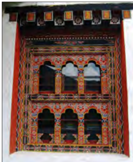
Vindue National Library of Bhutan.

Et filialbibliotek er under indretning i den tidligere kongelige residens i Kuenga Rabten, og et bibliotekssamarbejde med det nyetablerede Royal University of Bhutan står på ønskesedlen.