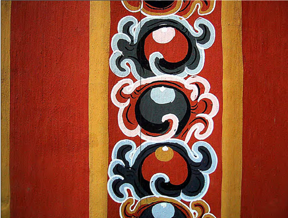
Dekoration på søjle, National Library of Bhutan.