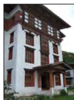
Hovedindgangen til Bhutans nationalbibliotek.

Forskningskomponenten har været et centralt aspekt i biblioteksprojektet, der er det første større eksternt støttede kulturprojekt i Bhutan. I projektets løb er en række væsentlige bøger og artikler blevet produceret af et hold danske og bhutanesiske forskere.