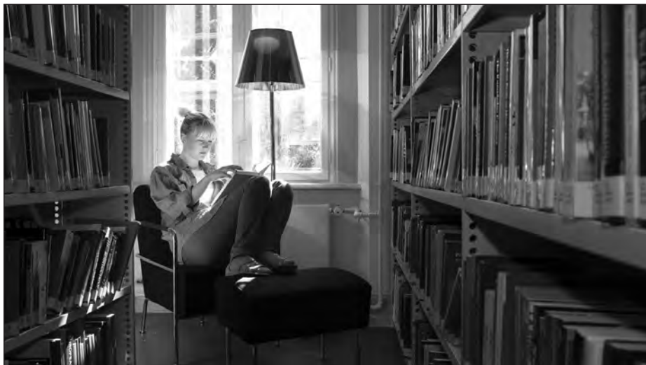
Studiemiljø i Det Samfundsvidenskabeligt Fakultetsbibliotek i Gothersgade 140.

nogle af læsesalene, så er biblioteket ikke længere et sted, man kun behøver at komme, når der er åbent.