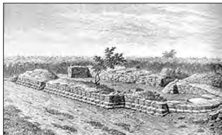
Ruiner af Knud Lavards Kapel ved Haraldsted. Kapellet blev bygget netop på det sted, hvor Knud Lavard dræbtes 7. januar 1131.

I et samarbejde med det canadiske Institute of Mediaeval Music har Det Kongelige Bibliotek foranlediget en viden-