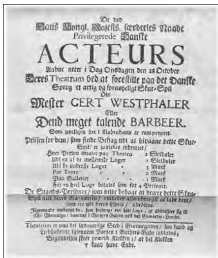
Den ældste bevarede teaterplakat for et af Holbergs stykker. Mester Gert Westphaler opførtes 22. oktober 1722.