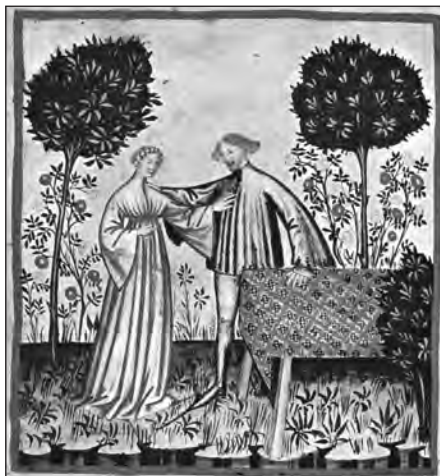
Lykke, tacuinum sanitatis casanatensis, 14. århundrede.