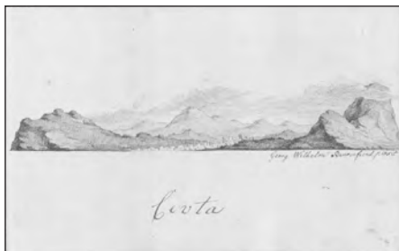
Tegning fra Carsten Niebuhrs stambog (Det Kongelige Bibliotek).

Stambøger skulle være lette at rejse rundt med. Niebuhrs stambog måler 12,5 x 20, 5 cm og består af 136