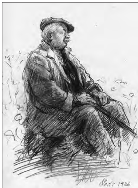
Tegning af Svend Asmussen fra 1936.

Bladtegnergangen, 30. august - 27. november 2010.