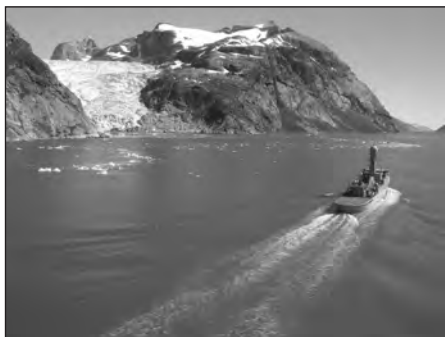
Flådens inspektionsskib af THETIS-klassen under sejlads ved Grønland.

samarbejde med Orlogsmuseet jubilæet med en stor udstilling, som tog udgangspunkt i flådens storhedstid i 1700-tallet. Udstyret med et kort over bibliotekets gange og gemakker og med søofficeren Peter Schiønnings dagbog som gennem-