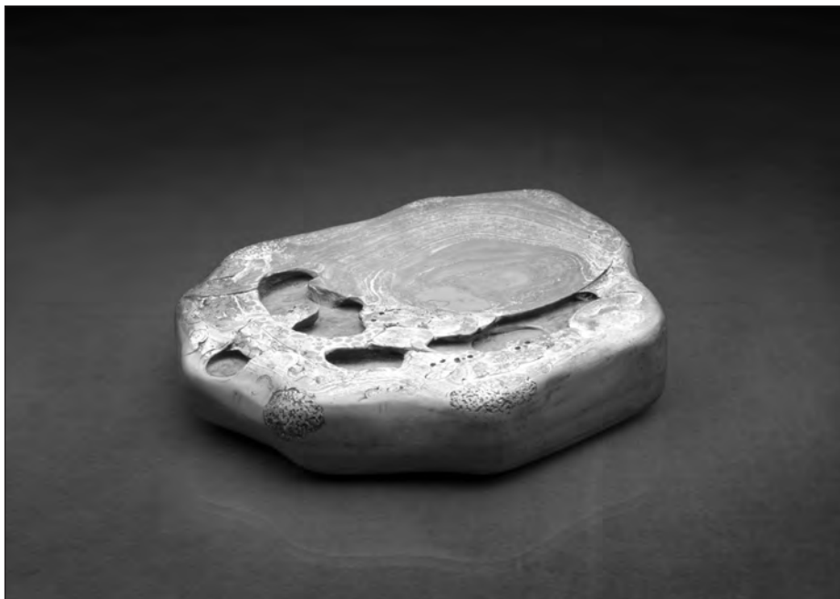
Kinesisk rivesten i grøn sten (Det Kongelige Bibliotek).

metal- vanddrypper, to små pensler og en kniv.