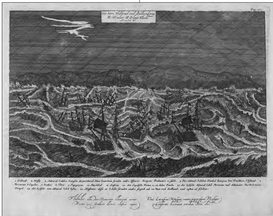
Det store skibbrud ved Gulland på Kong Frederik 2.s orlogslåde 1566.

Gennem et stort udvalg af genstande fra billeder, manuskripter, kort og bøger til tegninger, kanoner og våben fik den besøgende et ramsaltet indblik i livet til søs, i kamp på orlogsskibene og med mere fredelige sysler til lands i Flådens Leje. Udstillingen viste både elegante håndtegnede lærebøger i artilleri fra Søkadetakademiet, Frederik 5.'s Danske Atlas og en enestående samling af tegninger og illustrationer af sejlene skibe på togte fra 1750'erne, som aldrig før har været udstillet. Dertil kommer monumentale krigsskibsmodeller, sirligt udført og fuldt udrustede med kanoner, mast og sejl, der