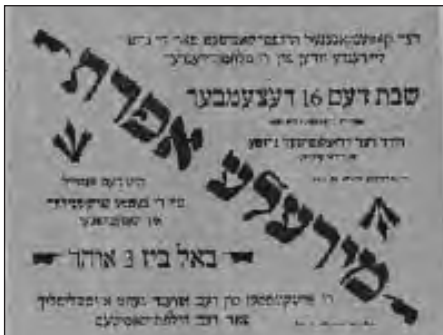
Programplakaten for den danske opførelse af Jacob Gordins drama Mirele Efros.