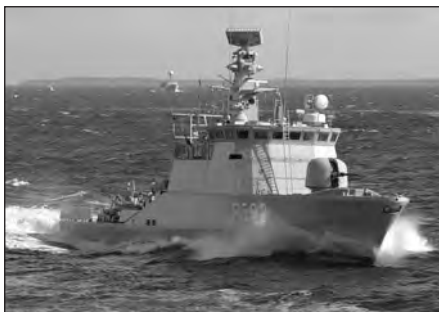
P 562 VIBEN i Øresund i forbindelse med afrejse fra barneophold i København under øvelsen DANEX 05, I, i 2005.