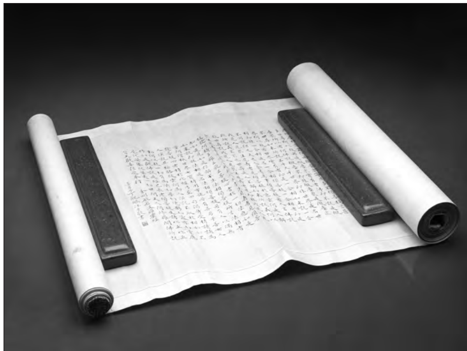
Kinesisk skriftrulle med Diamant sutraen (Det Kongelige Bibliotek).

af, at alt, hvad vi ser og tænker på, alene er forestillinger skabt af vores eget sind, som vi i stedet skal se som noget tomt og ufrugtbart.