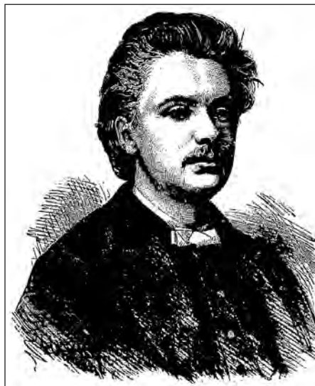
Edvard Grieg er blandt de komponister, der skrev kortsatser til Studenter-Sangforeningen. Fra ham findes et manuskript med tre sange tilegnet koret.

Når samlingen er nærmere katalogiseret, vil det for hvert af værkerne blive angivet, om der er tale om en nedskrift fra komponistens egen hånd