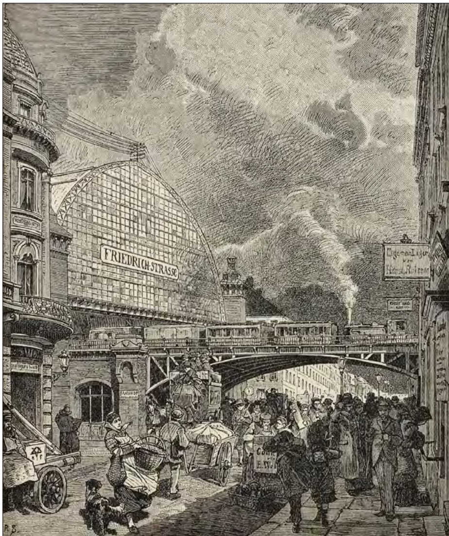
Friedrichstrasse Station fra 1878 blev fra begyndelsen et vigtigt berlinsk trafikalt knudepunkt. Georg Brandes var meget imponeret; over højden, bredden, lysen, den hensigtsmæssige indretning. Fra Berlin som tysk Rigshovedstad, 1885.

sagen om hans professorkandidatur med uformindsket styrke. Aviserne bugnede fortsat af kritiske indlæg fra Brandes' modstandere – ”Skældeartikler af lavtliggende Art”, som Brandes kaldte dem 6