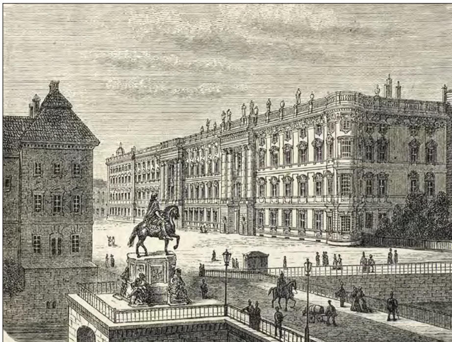
Slottet i Berlin blev opført i flere omgange, fra midten af 1400-tallet. Det fungerede som residens for markgreven og kurfyrsten af Brandenburg, senere for kongen af Preußen og den tyske kejser. Det lå på Spreeinsel i bydelen Mitte. Efter Novemberrevolutionen 1918 blev slottet bl.a. museum. Det blev svært beskadiget under anden verdenskrig og blev revet ned i 1950. På stedet opførtes i stedet for Palast der Republik, nedrevet 2006-2008. Fra Berlin som tysk Rigshovedstad, 1885.

blev indledningen til godt fem års landflygtighed med mismod og pengenød, men også arbejdsglæde og anseelse, i den tyske hovedstad.