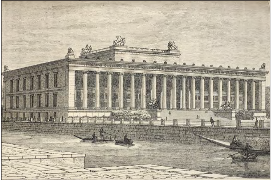
Altes Museum er det ældste museum på Museumsinsel i Berlin. Det blev opført 1825-1828 af Karl Friedrich Schinkel i klassisk stil. Det rummer blandt andet antiksamlingen. Fra Berlin som tysk Rigshovedstad, 1885.