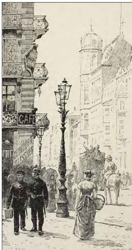
En gade i Berlin. Fra Berlin som tysk Righovedstad, 1885.