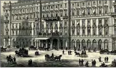
Holet Kaiserhof var Berlins første luksushotel. Her holdt Georg Brandes sin afskedsfest i Berlin. Illustration fra 1876.

for galleriet. For faktum var, at Brandes nu kunne vende hjem uden at tabe ansigt og tilmed være økonomisk sikret de næste mange år.