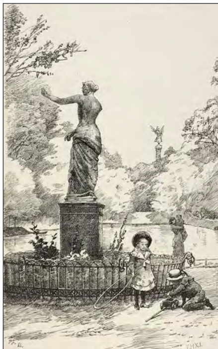
Tiergarten er en 210 hektar stor park i bydelen Tiergarten midt i Berlin. Landskabsparken blev skabt af Peter Joseph Lenné i 1830. Her guldfiskeparken. Fra Berlin som tysk Righovedstad, 1885.

”Til alle Sider for mine Øine som et grønt Hav Kronerne af Thiergartens smukke Træer. Tilvenstre skinner Scirssøjens gyldne Victoria i sin hele skjærende Glands mod en lyseblaa solklar Himmel. I nogen Afstand