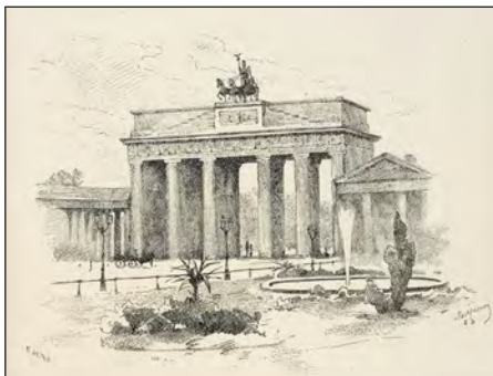
Brandenburger Tor på Pariser Platz blev opført 1788-1791 og betragtes som byens vigtigste vartegn. Porten er 26 m høj, 65,5 m bred og 11 m dyb. Fra Berlin som tysk Rigshovedstad, 1885.

han således følgende idé: ”Jeg maa fortælle dig – men snak ei om det, da det muligt intet bliver til – at jeg har faaet den Idee at ville optræde offentl. som Thaler her i Berlin (...) det vilde gjøre mig meget bekjendt og vilde altid vække Interesse at en Fremmed talte.” 11