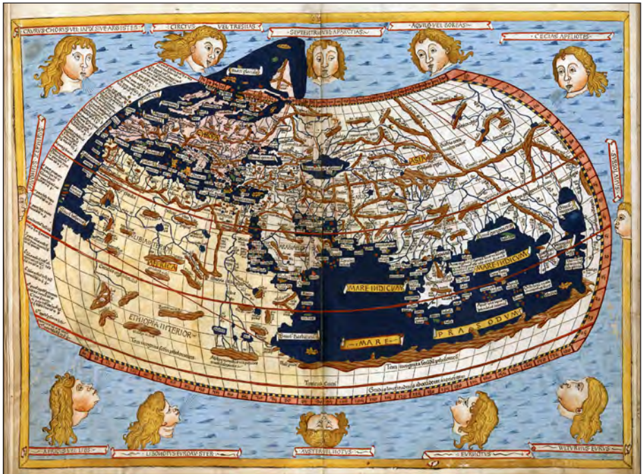
Oversættelsen af Ptolemaios' Almagest til latin o. 1175 er en afgørende begivenhed i naturvidenskabens historie. Det ptolemaiske verdensbillede med Jorden i centrum var uanfæget gennem middelalderen. Her en gengivelse af verdenskortet efter Ptolemaios' beskrivelse i en trykt udgave af hans værker fra 1486 (Det Kongelige Bibliotek).

ting velkendte træk hos Heiberg) præger teksten. Hør blot analysen af Willumsen portrættet fra 1915, som i dag hænger på kunstmuseet Aros. Det forestiller Sophus Claussen, der læser sit digt Emperium , der handler om naturen som truer menneskeheden og civilisationen, højt for Helge Rode og Willumsen selv: “I en tilstand af skrækpræget fascination synes Rode – den kristne lyriker – at slå kors for sig med både arme og ben, mens Willumsen må støtte sig til divanen for ikke at blive blæst omkuld af de Claussenske jordskælv”. Danske portrætter er en ny måde at behandle portrætgenren på – et værk, der selvfølgelig også bygger på den foreliggende forsk-