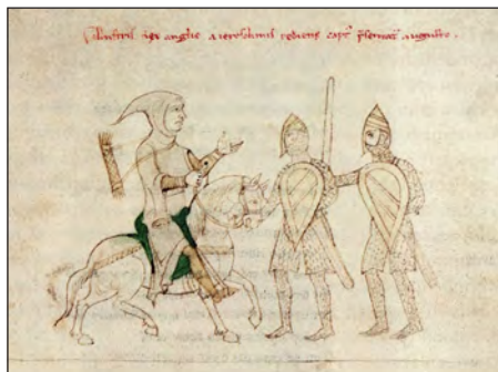
Tilfangetagelsen af Richard Lövehjerte i Erlberg ved Wien. Fra Liber ad honorem Augusti sive de rebus Siculis des Petrus de Ebulo, 1196.