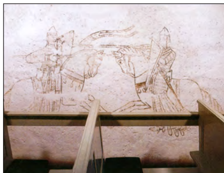
Dystridt mellem to riddere. Kalkmaleri ca. 1200. Lyngby Kirke ved Århus. Foto: Steffen Heiberg. Fra En ny begyndelse , 2008.

Heiberg skriver, så det er en fornøjelse at læse. Stilen er autoritær forstået på den måde, at tanker og sammenhænge sjældent fremsættes som hypoteser. Næh, sådan og sådan forholder det sig – og jeg er sikker på, at Heiberg til enhver tid ville stille op til forsvar for sine synspunkter og for det, han har skrevet. Men stilen kan også være let og ofte krydret med humor. Jeg kan ikke lade være med at nævne et eksempel fra kapitlet, hvor det høj- og senmiddelalderlige hoffiv med dets ridderturneringer behandles. Ridderturneringerne kunne være farlige, ja direkte dødsensfarlige. Henrik II af England lod af den grund turneringer forbyde, men hans søn Rikard Lövehjerte tillod i visse tilfælde og mod betaling, at turneringer blev afholdt. En