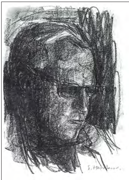
Ole Wivel tegnet af Sven Havsteen-Mikkelsen. Fra Ringen omkring Ole, 2004 (Det Kongelige Bibliotek).