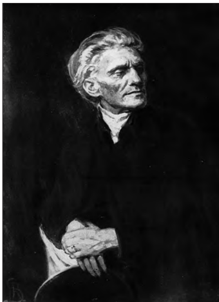
Stefan George (1868 - 1933), tysk digter og forfatter.

andre, som har været i historikernes og offentlighedens skudlinje, er alle døde. Og ingen havde vist forestillet sig, at der pludselig ville dukke sager om 'unational opførsel' op mod nulevende, prominente danskere. Men så kom sagen om "Ringene" og sendte chokbølger gennem dansk kulturliv, som stadig vibrerer.