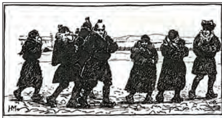
Fra Knud Rasmussens bog Lapland , 1907, illustreret af bl.a. Harald Moltke. Vignet til kapitlet ”Konfirmationsdage”.

Overfor dem stiller han ”dem derhjemme”. Dem derhjemme, det er københavnerne. ”De minder mig om Eremitkrebsen i Havet. Den lever det første og det korteste Stadium af sit Liv frit om paa Æventyr i det store dybe Hav. Men naar den har naaet en vis Grad i sin Udvikling, overvældes den af Fornuft, fælder bitre Taarer over sin vilde Ungdom og giver sig pludselig til at bygge Hus og sætte Bo. Og den graver sig dybt ned i Sandet og henlever der et daadløst Fangeliv, indtil den en Dag dør