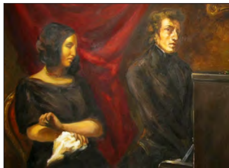
George Sand og Frederic Chopin. Udkast til maleri, 1838, af Eugène Delacroix.

Var de hinandens frelse eller forbandelse? Det ville vi nok aldrig få afklaret, men både deres liv og deres værk ville se anderledes ud, hvis de ikke havde mødt hinanden.