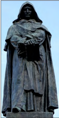
Den 17. februar i jubilæret 1600 under Clemens VIII's pævedømme blev Bruno kneblet og ført til pladsen Campo dei Fiori i Rom og brændt. En statue af Giordano Bruno skabt af Ettore Ferrari rejstes i 1889 på pladsen.

søgte videnskabsmænd som Tycho Brahe, Kepler, Galilei og Newton indædt at afklare spørgsmålet om 'en jord i bevægelse'. Det førte til en åben konflikt med kirken, som idømte Galilei livsvarig husarrest og brændte filosofen Giordano Bruno på bålet.