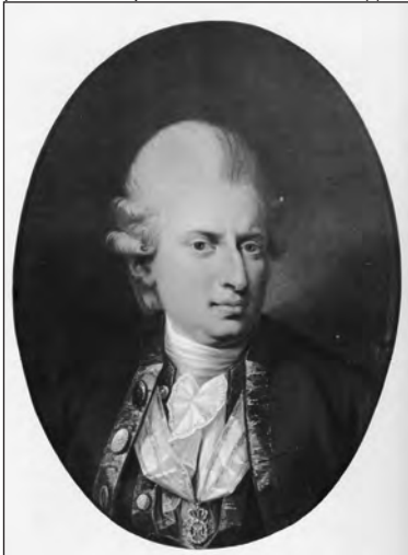
Livlægen Johan Friedrich Struensee, der blev benrettet og lagt på hjul og stejle 28. april 1772. Maleri af Jens Juel.