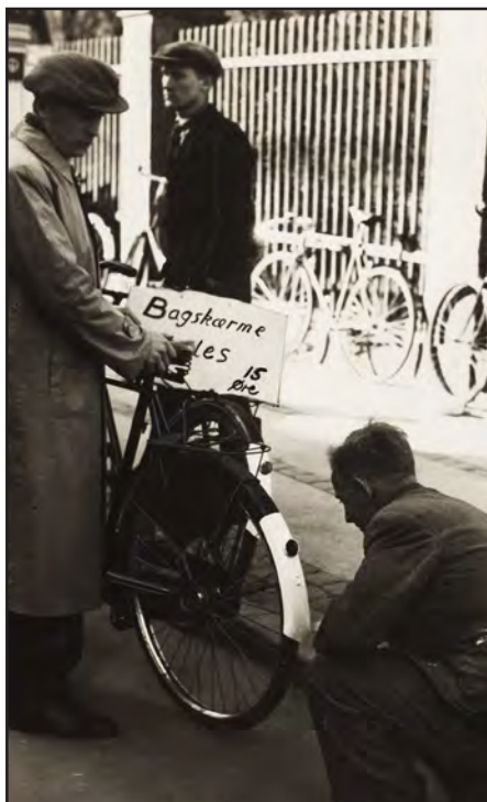
Kombinationen af mørklegning og øget anvendelse af cykler gav kortvarigt ny beskæftigelse ved. f.eks. hvidmaling af bagskærme.