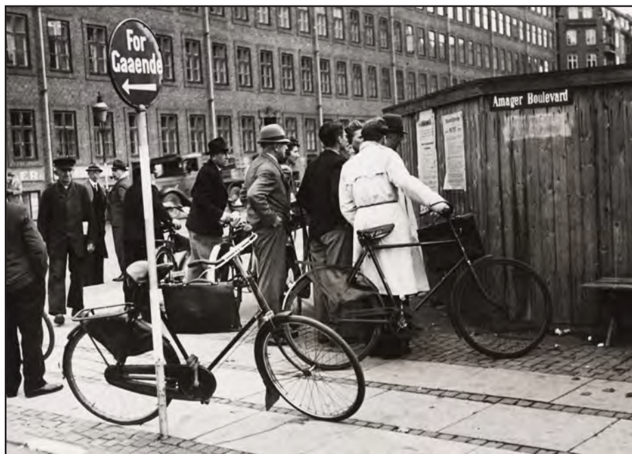
Cyklister er stået af ved Amager Boulevard, København, for at studere et opslag (Det Kongelige Bibliotek).

jagtgeværer, den 15. oktober fik ejere af lystfartøjer besked om, at fartøjerne skulle bringes på land, ligesom tilladelsen til roning i Københavns havn bortfaldt. Fire dage senere blev forbudet mod jagt og fiskeri på Københavns fæstningsterræn indskrænket, ligesom man fra tysk militær side blev advaret mod at nærme sig flyvemaskinerne i marineflyvelejren i Ålborg. 4 Det var stort og småt imellem hinanden.