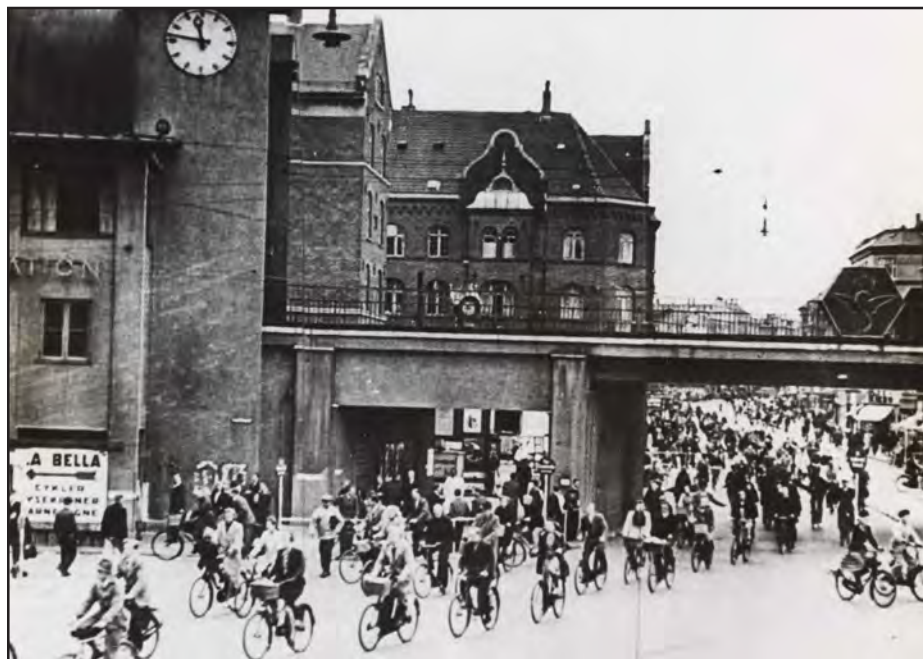
Günther Pancke meddelte 16. september, at 200 fanger fra Frøslevlejren var deporteret til Tyskland. Det udløste en strejke i Sønderjylland, der bredte sig til hele landet. Kort før afblåsningen af strejken to dage senere myldrede cyklisterne ud på gaden igen, som her ved Nørrebro Station i København.

at Best havde fået ret i forhold til von Hanneken, og dermed havde vundet en lille sejr. Uden at skrive det direkte lod Ritter dog Best forstå, at denne sag havde været helt unødvendig. Når Best fra starten af OKW var tillagt retten til at bestemme omfanget af de cykler, der skulle beslaglægges, havde sagen kunnet være klarer uden at indblande hverken det tyske udenrigsministerium, OKW, udenrigsministeren personligt eller føreren selv. Når det alligevel var sket, så var det fordi Best havde undladt at informere udenrigsministeriet om det fulde omfang af OKW's ordre til von Hanneken. 12