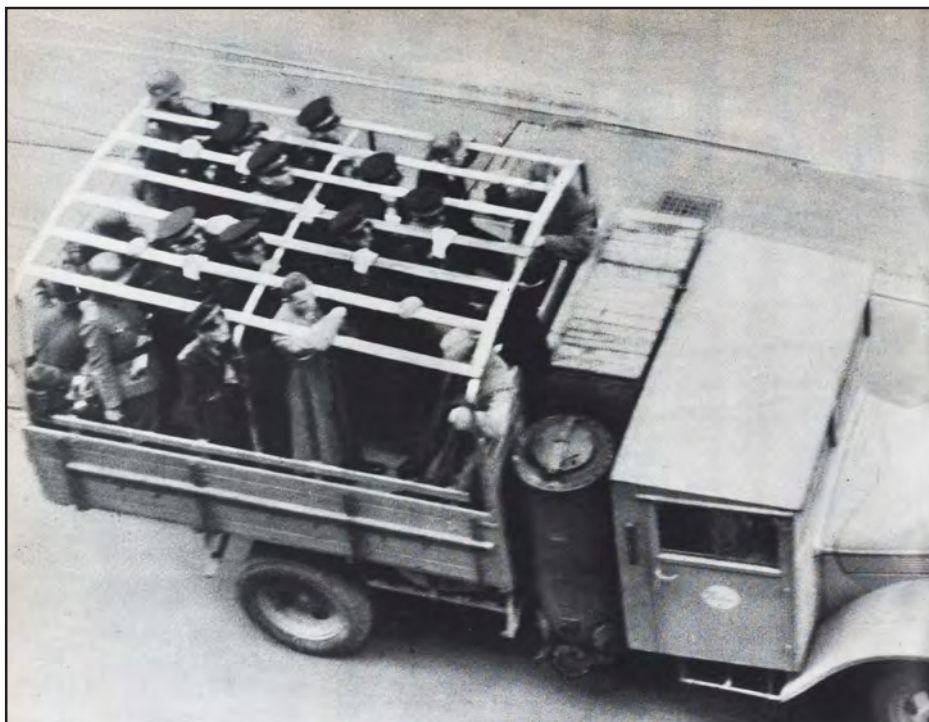
Arresterede danske politimænd i København bliver 19. september 1944 kørt bort på en lastbil til foreløbig internering. Samme nat blev i alt 1.912 danske politimænd sejlet fra Frihavnen til Tyskland.