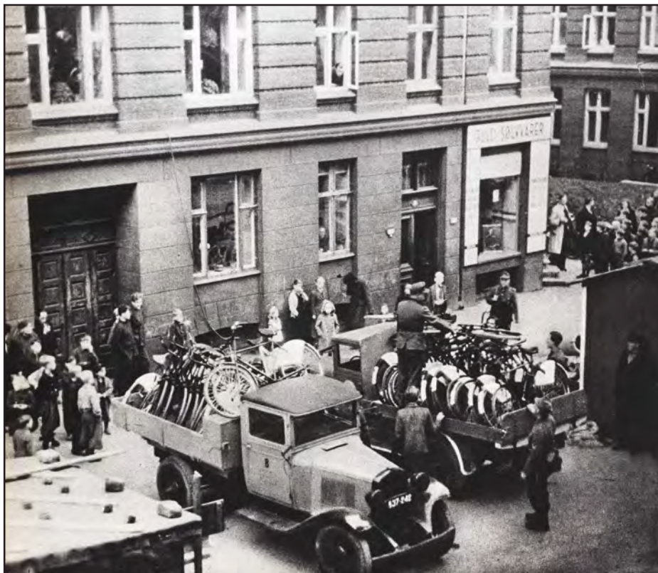
To lastvogne er kørt frem. Tyske soldater i København i færd med at beslaglægge cykler 26. oktober 1944. Regningen for cyklerne blev sendt til Nationalbanken (Det Kongelige Bibliotek).

ber, men forinden blev førerbeslutningens første del realiseret.